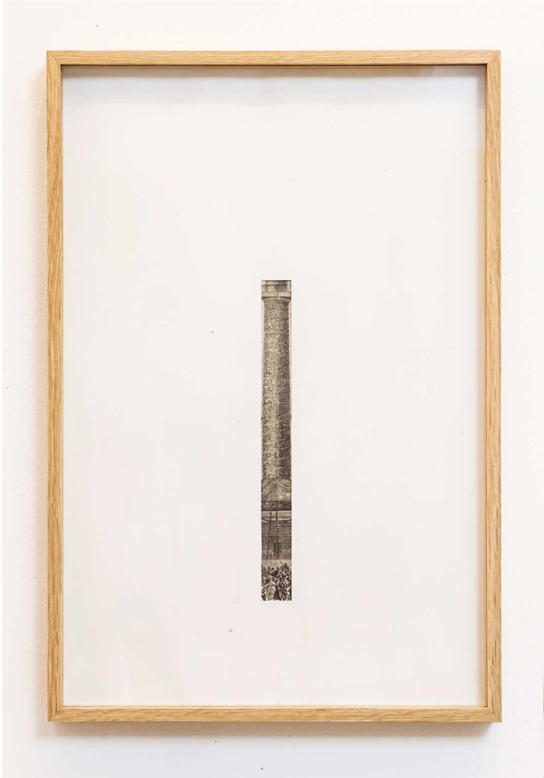
"Sin título (Illustrated)", 2014. Material impreso enmarcado, 46x31