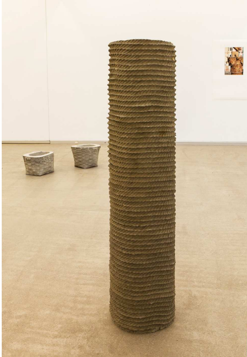
"Columna infame", 2014. Hormigón, 160x37