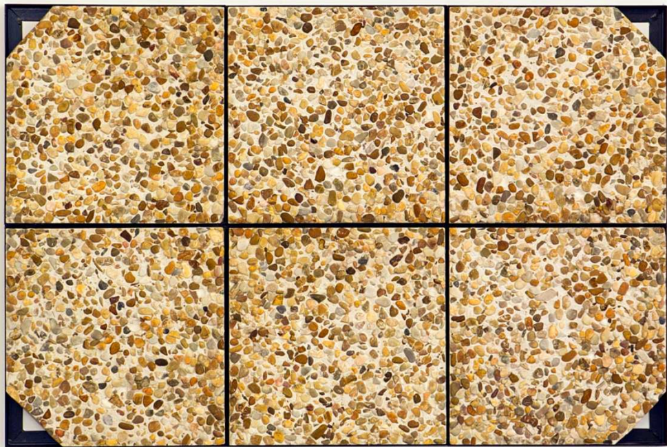
"Placa (La Foule)", 2014. Hormigón, guijarros y hierro, 82x122