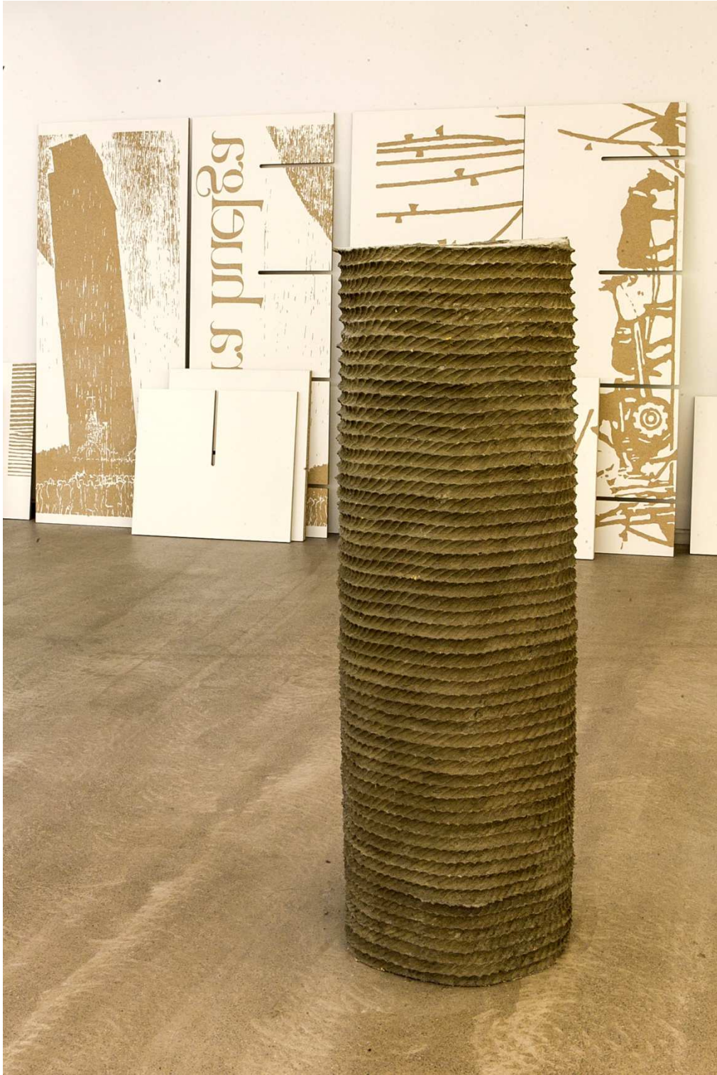
"Columna infame", 2014. Hormigón, 145x46