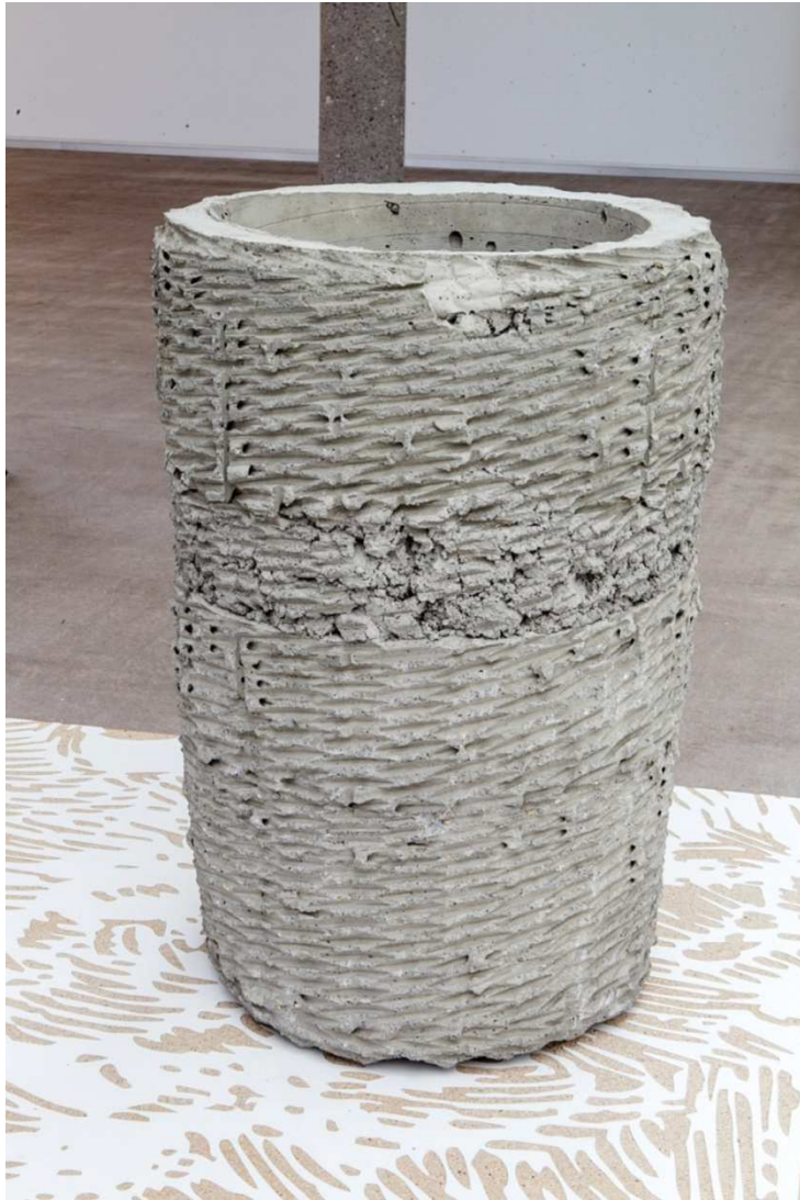
"Sin título (Wicker)", 2014. Hormigón, 61x40cm