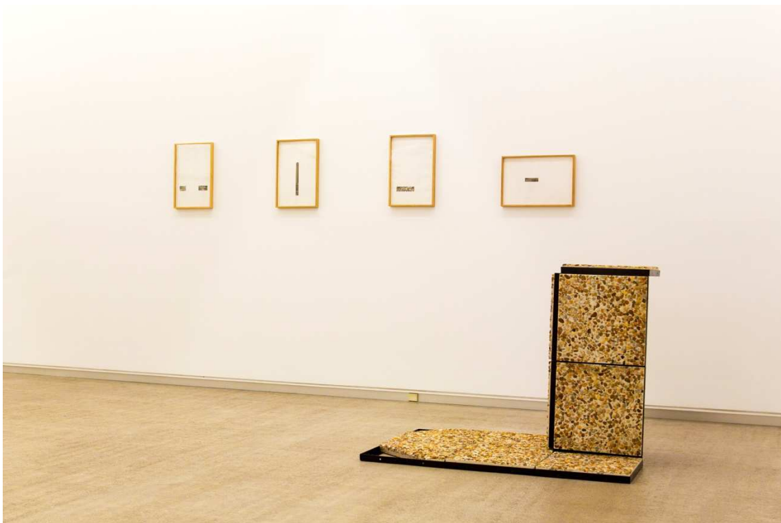
"Peana (La Foule)", 2014. Hormigón, guijarros y hierro, 90x122x82