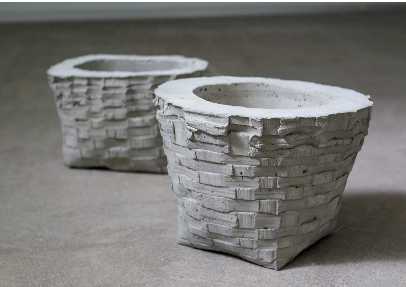
"Sin título (Saski)", 2014. Hormigón.