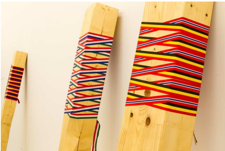
"Ertz zorrotza (Masta)", 2014. Madera y textil, 200x20x14