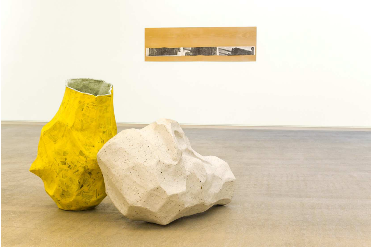
"Cabeza, puño, árbol", 2014. Papel Maché (2 elementos), 95x60x60 / 82x53x56