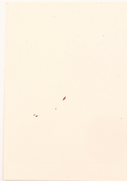
"Sin título (Illustrated)", 2014. Material impreso enmarcado, 46x31