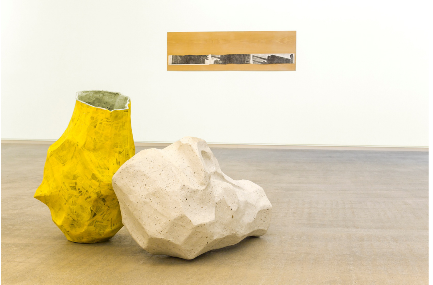
"Cabeza, puño, árbol", 2014. Papel Maché (2 elementos), 95x60x60 / 82x53x56