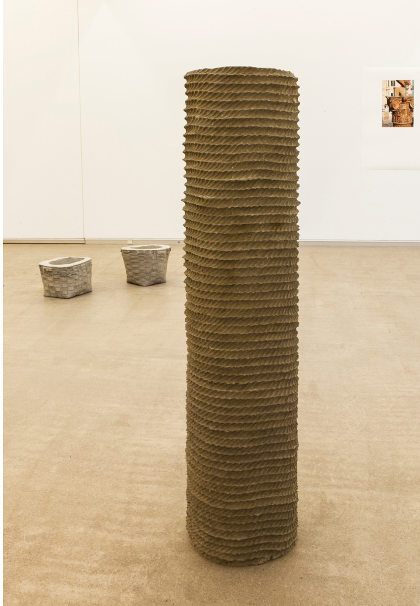
" Columna infame ", 2014. Hormigón, 160x37