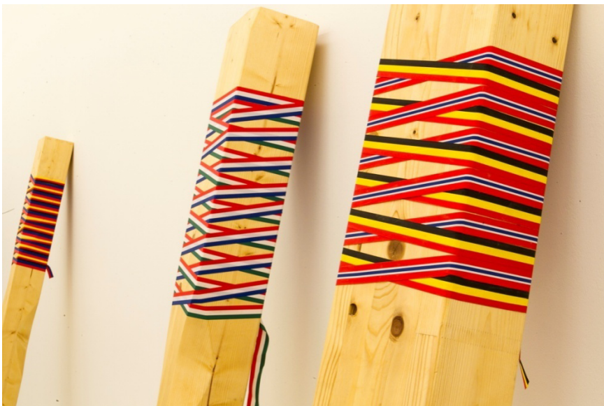
"Ertz zorrotza (Masta)", 2014. Madera y textil, 200x20x14