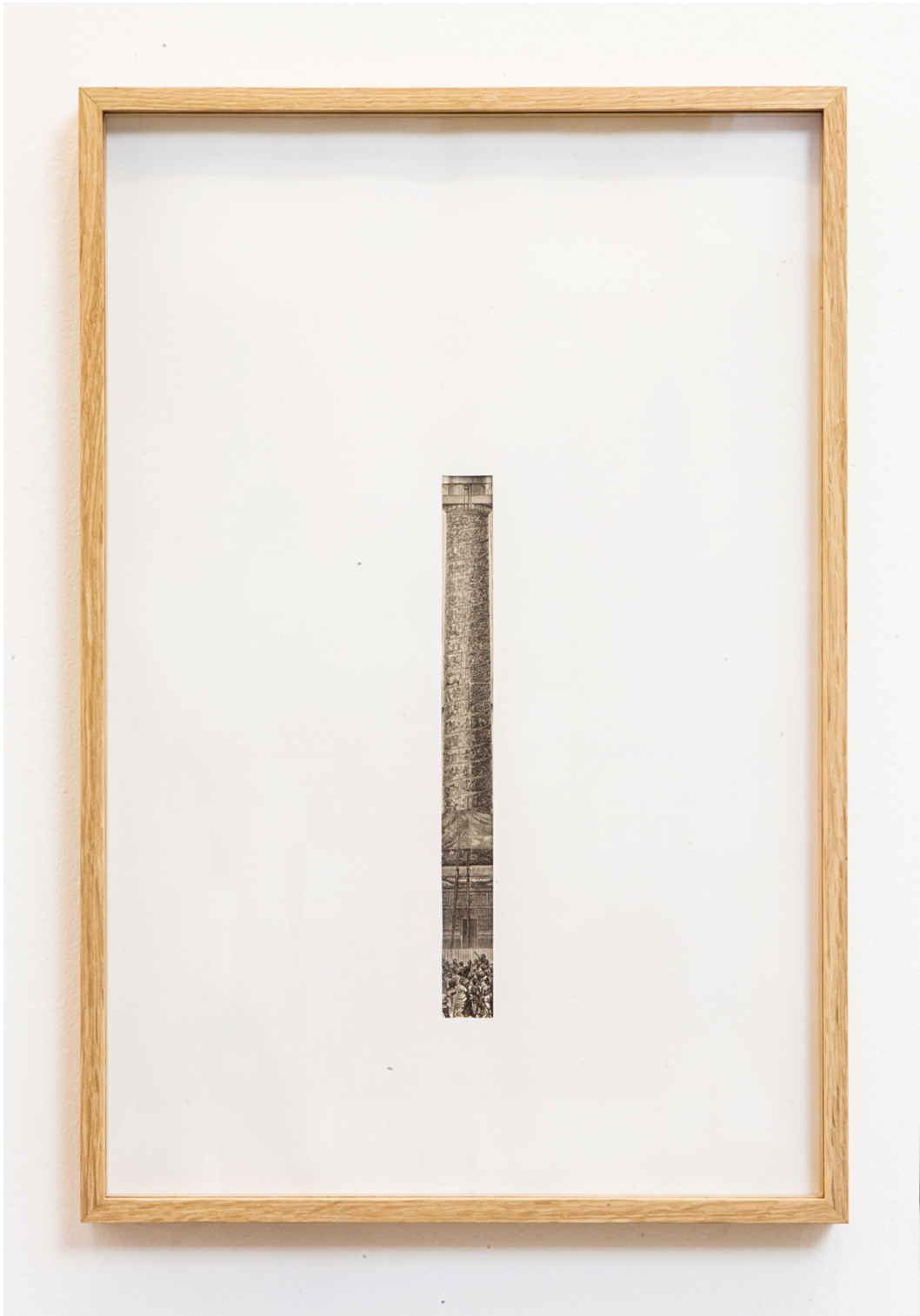
"Sin título (Illustrated)", 2014. Material impreso enmarcado, 46x31