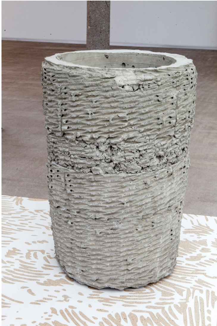
"Sin título (Wicker)", 2014. Hormigón, 61x40cm