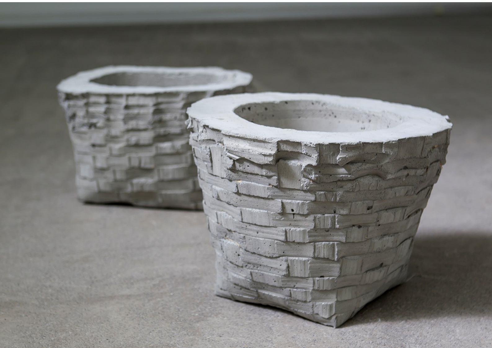
"Sin título (Saski)", 2014. Hormigón.