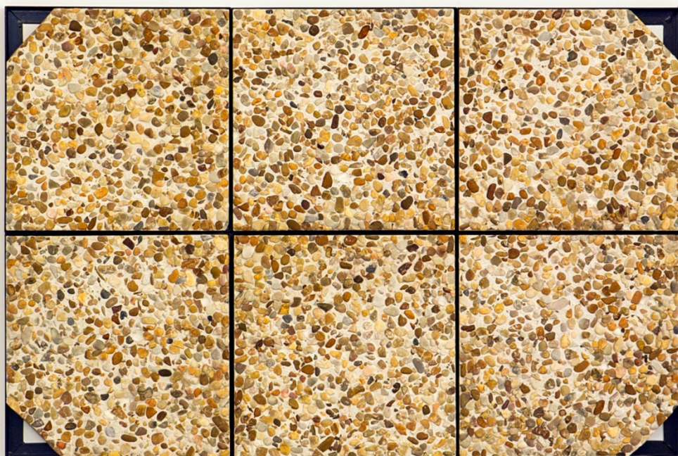
"Placa (La Foule)", 2014. Hormigón, guijarros y hierro, 82x122