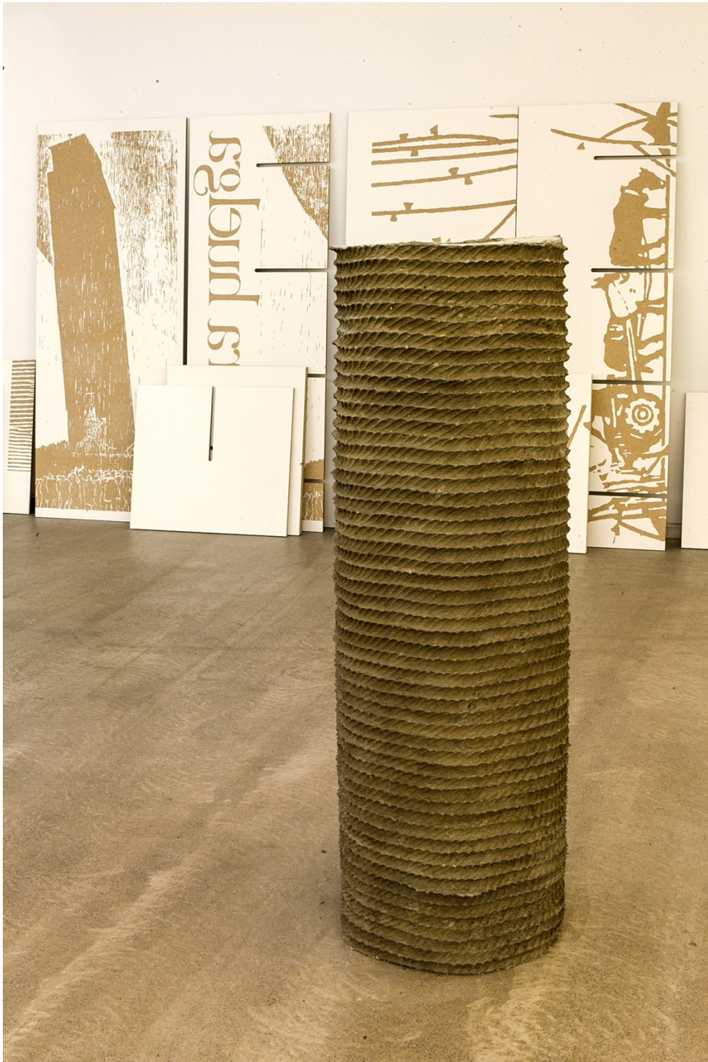
"Columna infame", 2014. Hormigón, 145x46