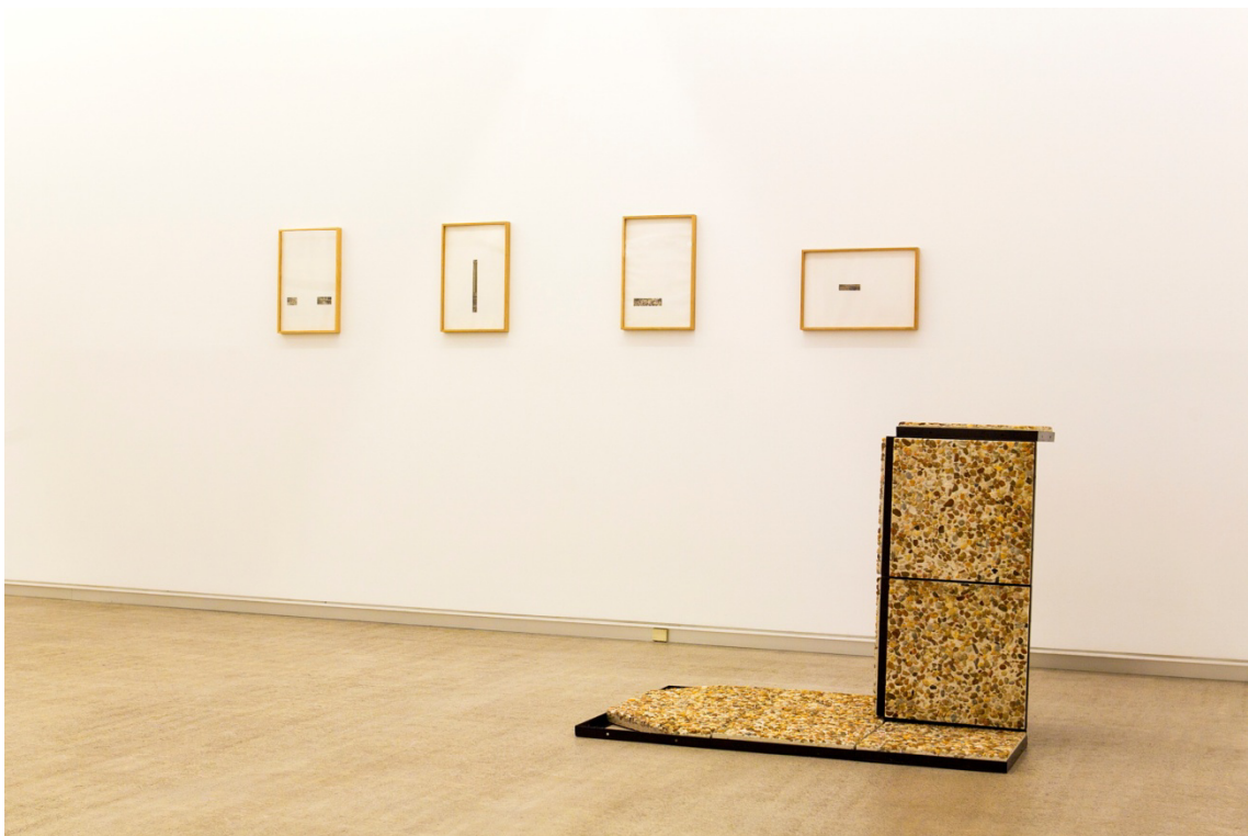
"Peana (La Foule)", 2014. Hormigón, guijarros y hierro, 90x122x82