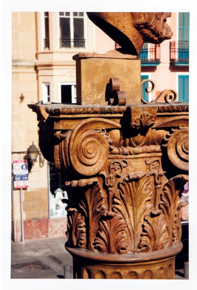
"Gurentza-Unamuno", 2014. Impresión fotográfica sobre papel Hannemühle, 120x85