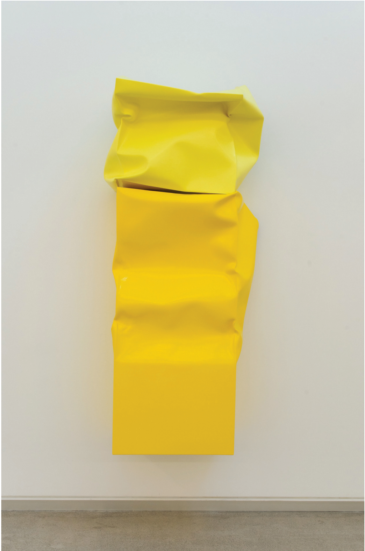
Box Large with Small Box (Yellow), 2015. Óleo y acrílico sobre aluminio. 170 × 77 × 48 cm