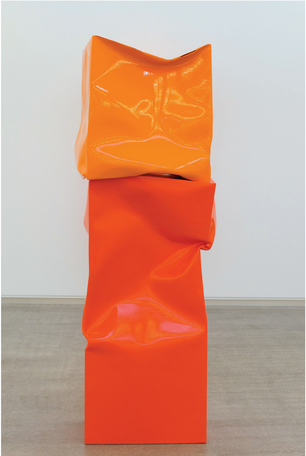
Standing up Box Large with Small Box (Orange), 2015. Óleo y acrílico sobre aluminio. 176 × 60 × 42 cm