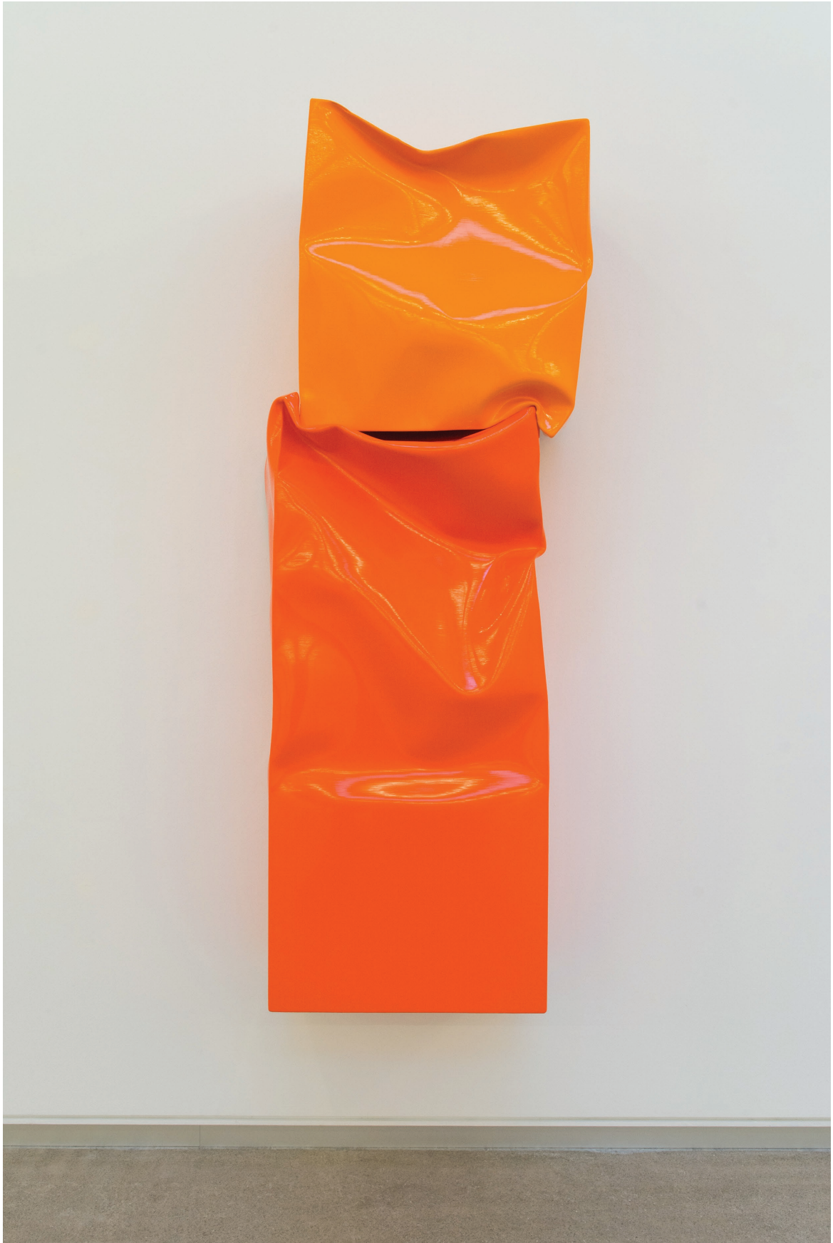
Box Large with Small Box (Orange), 2015. Óleo y acrílico sobre aluminio. 170 × 58 × 42 cm