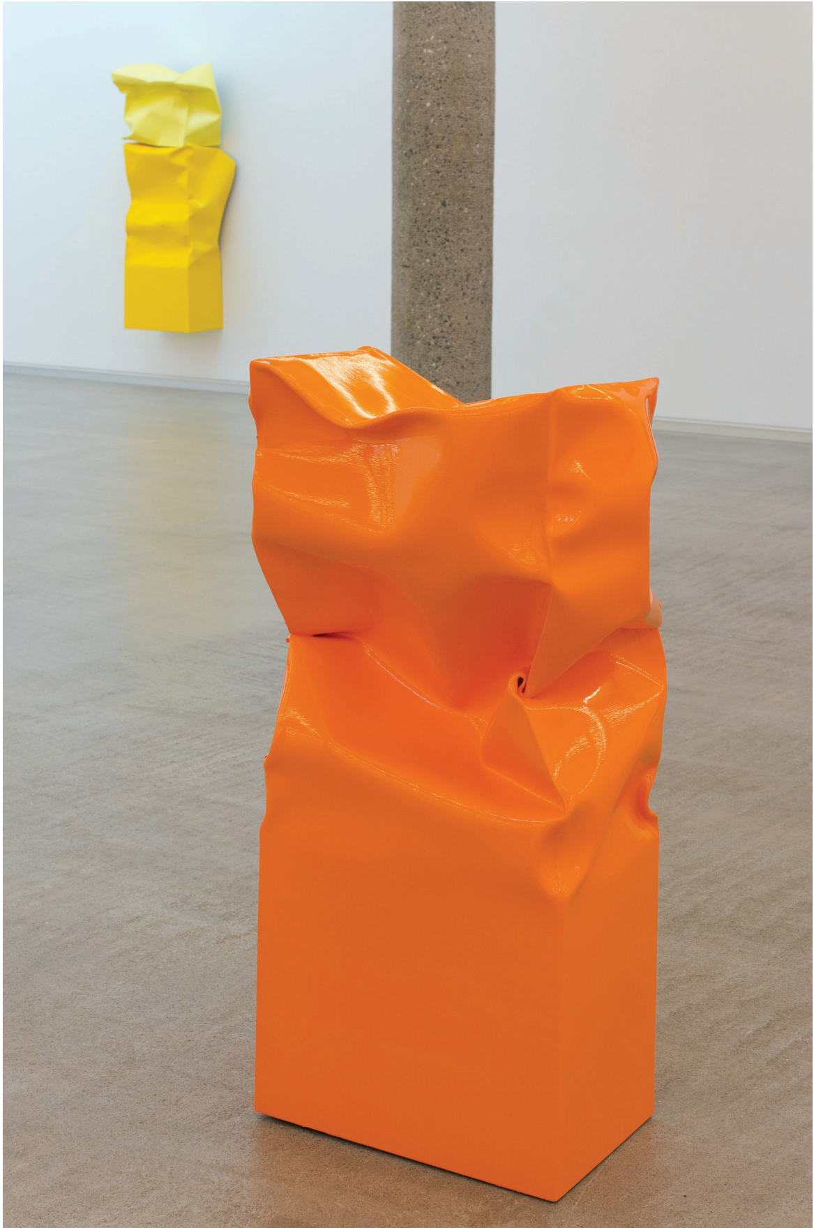
Standing up Box Large (Light Orange), 2015. Óleo y acrílico sobre aluminio. 124 × 61 × 44 cm