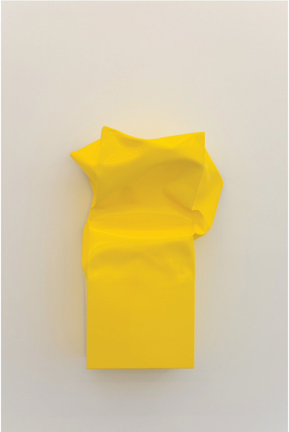
Box Large (Yellow), 2015. Óleo y acrílico sobre aluminio. 132 × 87 × 40 cm