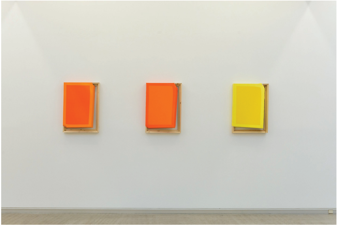
Tigth (oraneg, Yellow, Dark Orange/Orange) 2015. Oleo sobre lienzo.110x47x59 cm.