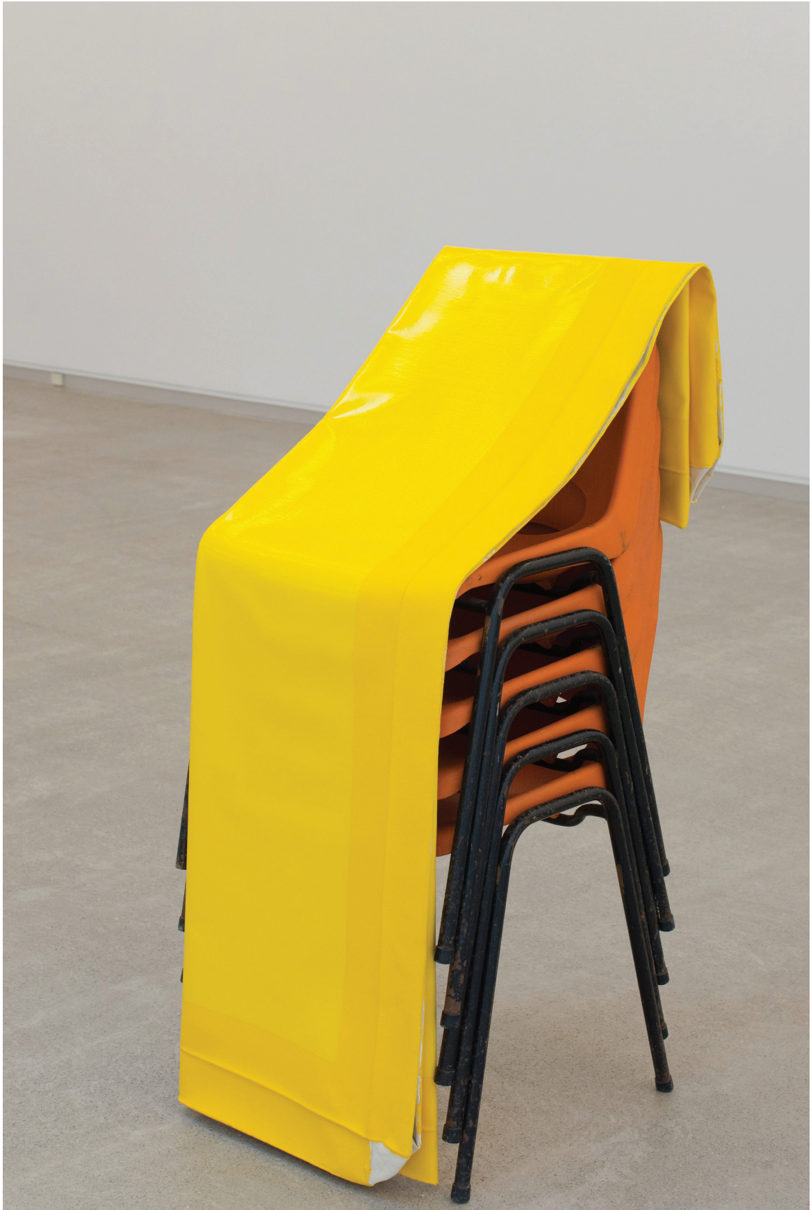
Box Large (Yellow), 2015. Óleo y acrílico sobre aluminio. 132 × 87 × 40 cm