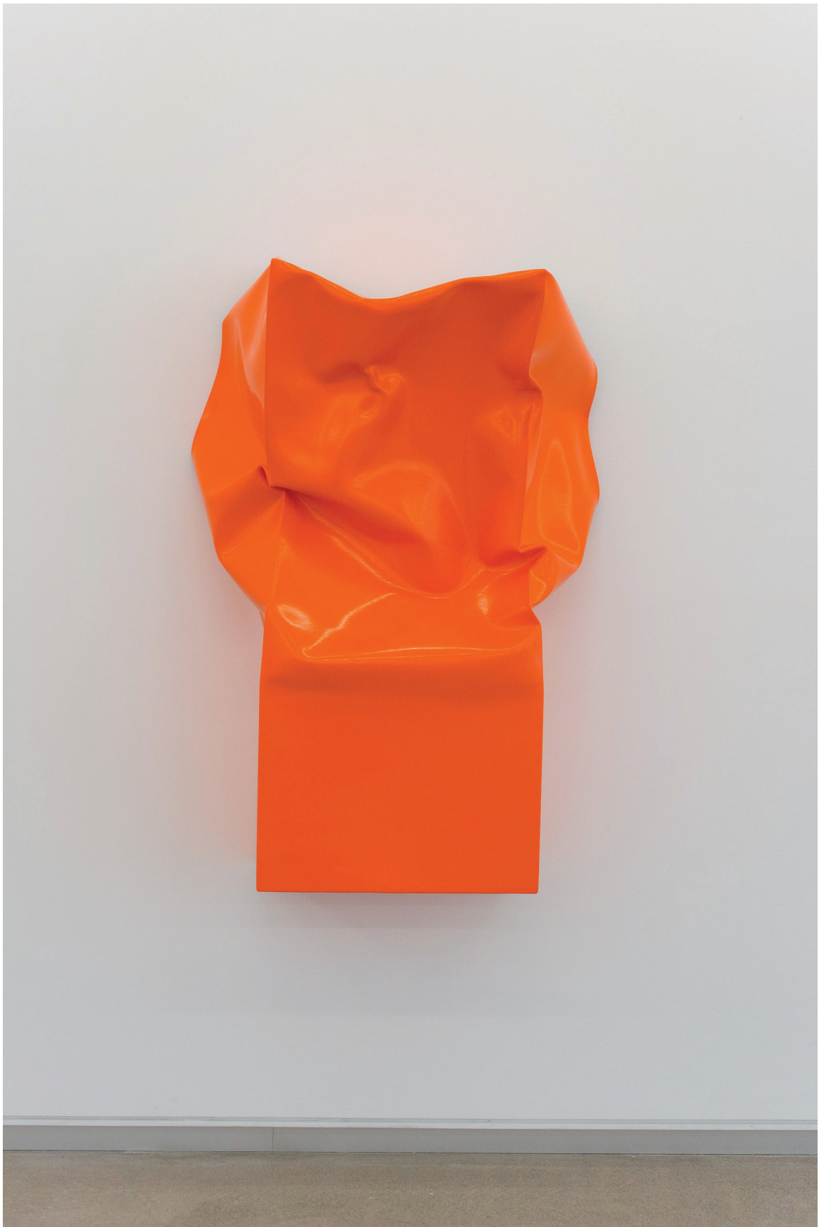
Box Large (Orange), 2015. Óleo y acrílico sobre aluminio. 123 × 86 × 43 cm