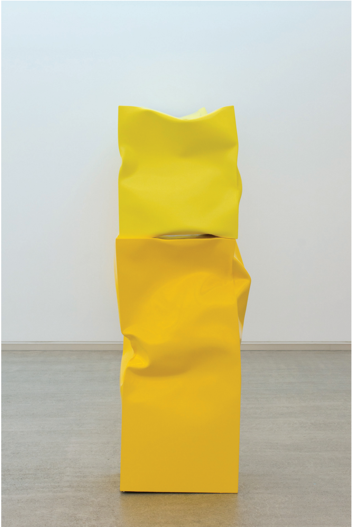
Standing up Box Large with Small Box (Yellow), 2015. Óleo y acrílico sobre aluminio. 176 × 60 × 40 cm