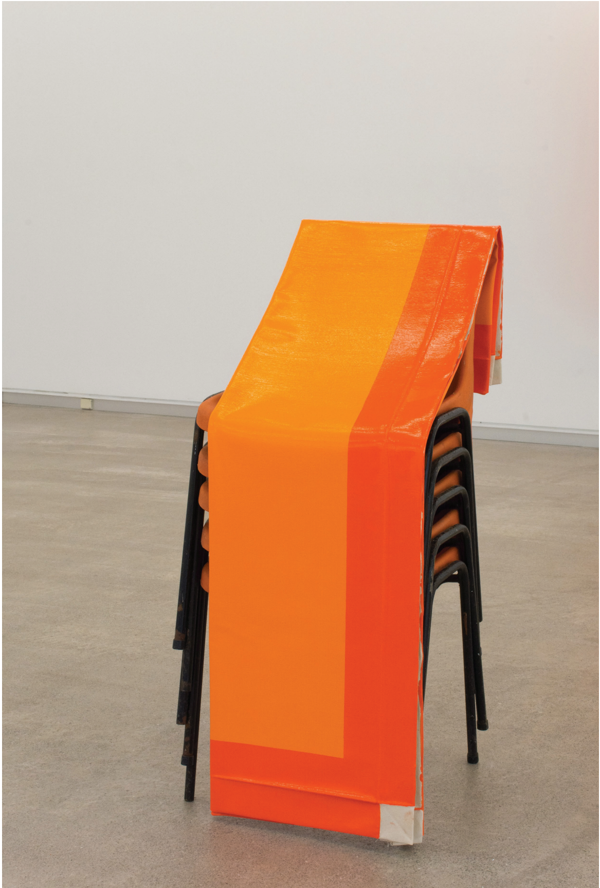
Mudanza (Orange), 2015. Sillas y óleo sobre lienzo. 110 × 47 × 59 cm