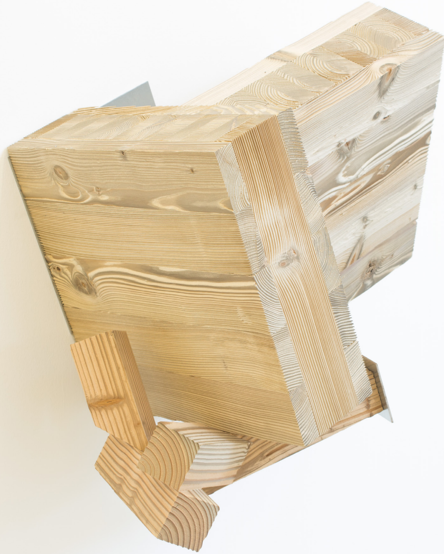
Titulo gabe, 2019. Egurrezko eraikuntza eta altzairu galvanizatua. 85 x 80 x 45 cm.