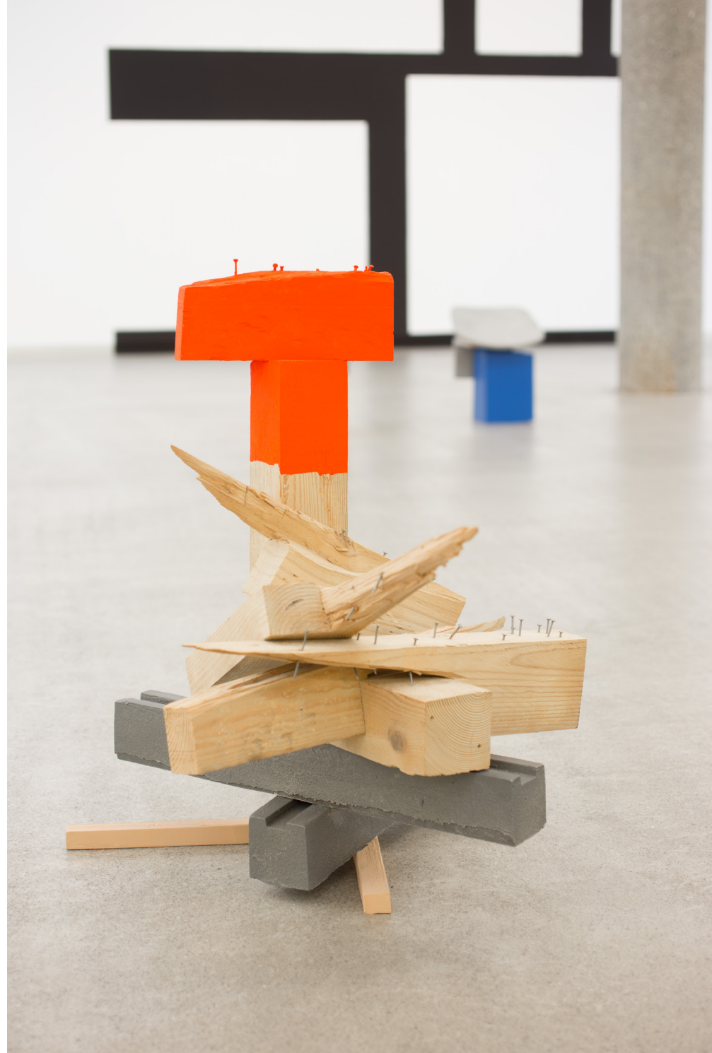
Dardara , 2019. Galdatutako eta soldatutako aluminiozko elementuak, egurra, iltzeak eta pintura. 60 x 60 x 64 cm.