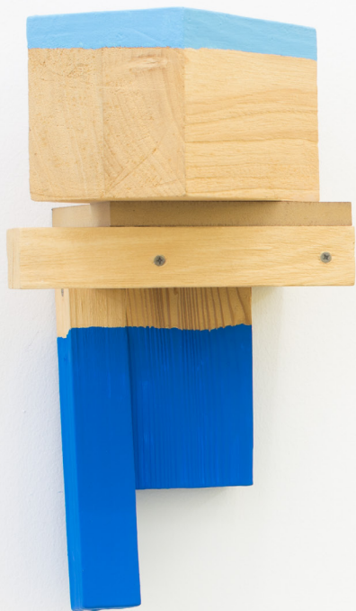
Saludo (paisaje) , 2019 Egurrezko eraikuntza eta pintura. 40 x 23 x 24,5 cm