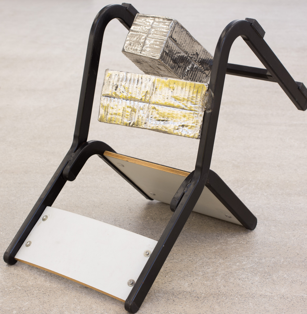
Dardara (interior) , 2019

Burdina, egurra, galdatutako eta soldatutako altzairu herdoilgaitzezko elementuak eta pintura. 46 x 63 x 32 cm.