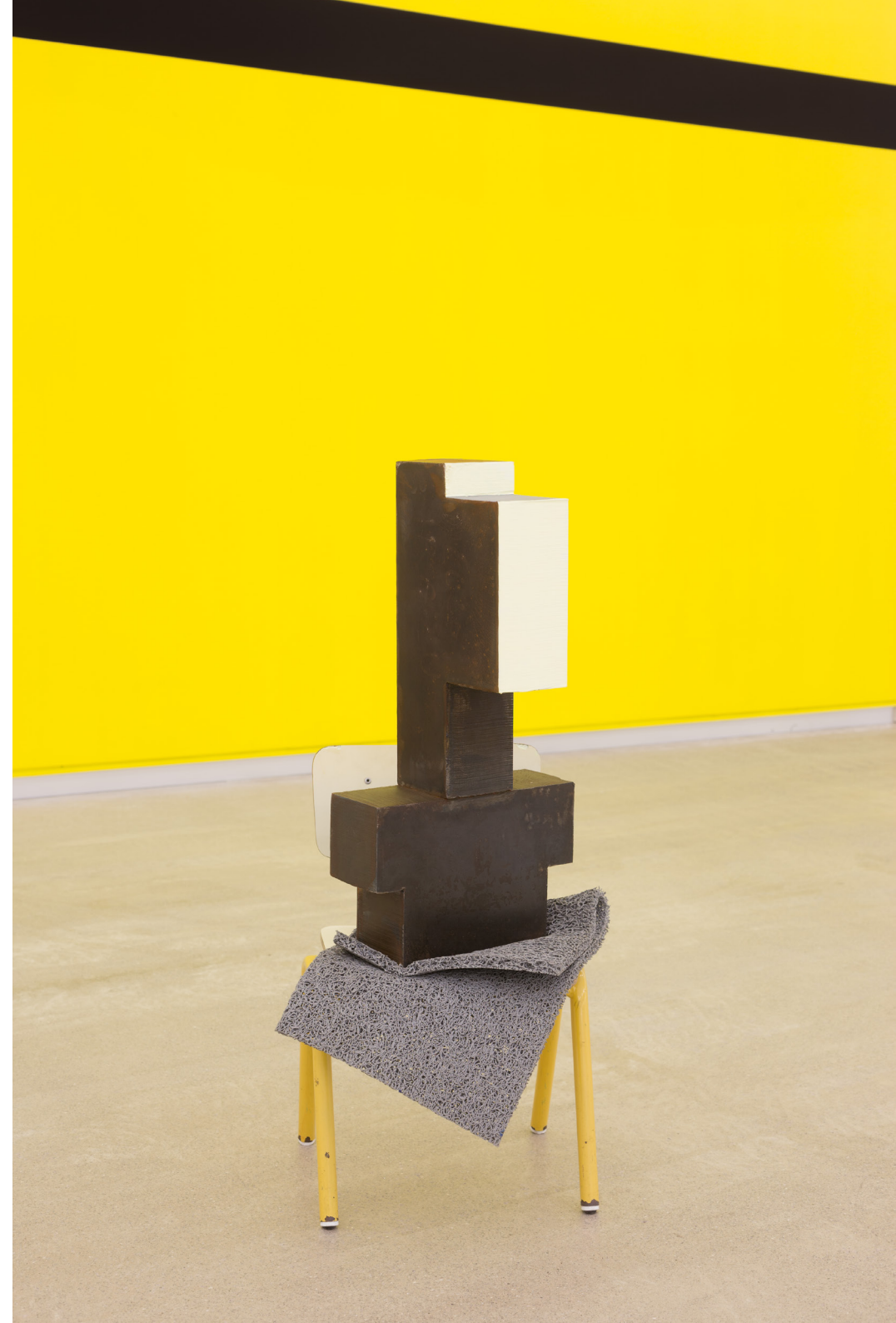
Dardara I , 2019 Altzairua, egurra, burdina, feltroa eta pintura. 91 x 40 x 40 cm.