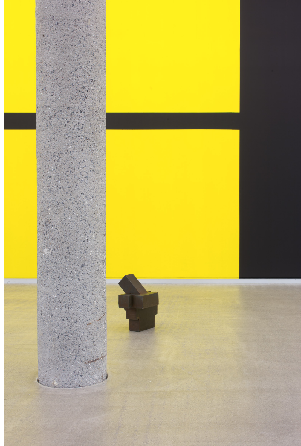
Bikote , 2019 Burdina. 44 x 39 x 38 cm.