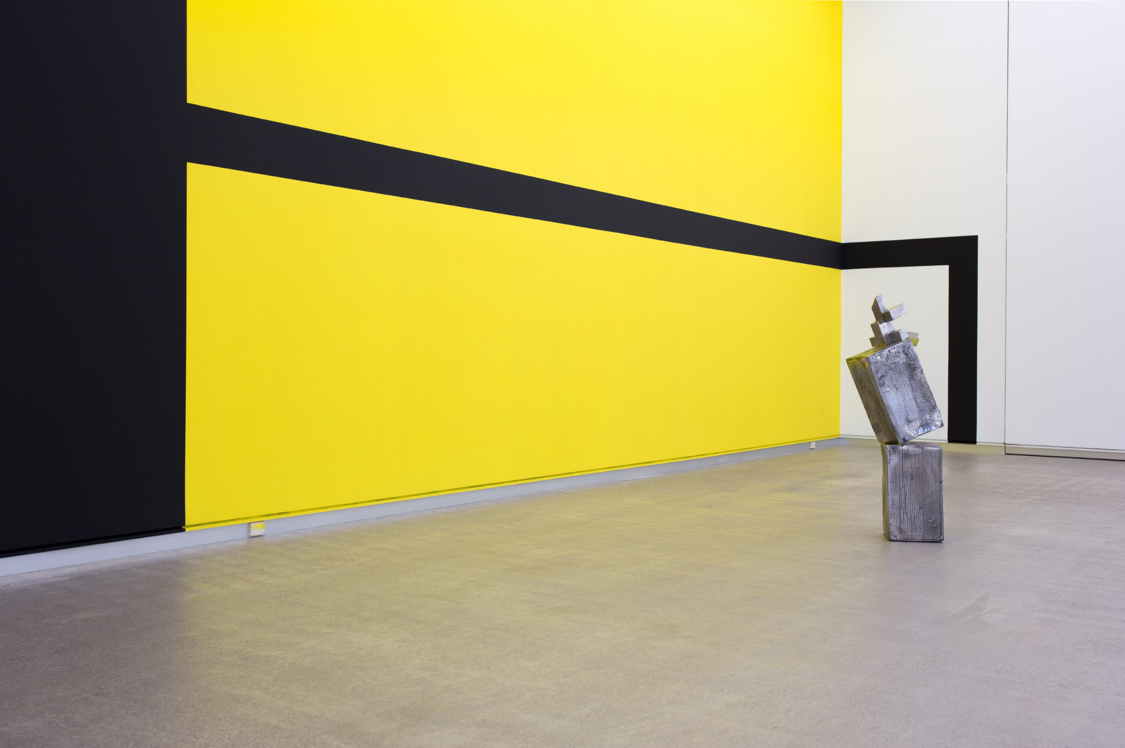
Ibiltari , 2019 Galdatutako eta soldatutako altzairu herdoilgaitzezko elementuak eta pintura. 92 x 24 x 28 cm.