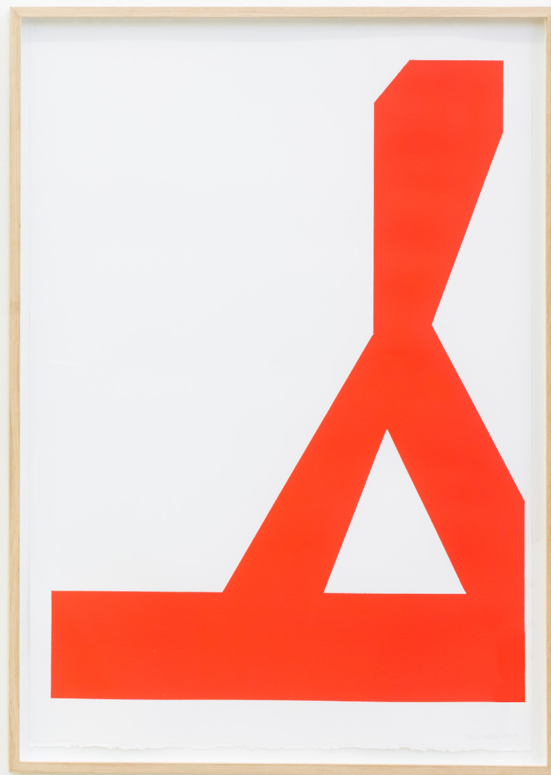
Sólido II, 2019 Pintura paper gainean. 100 x 70 cm.