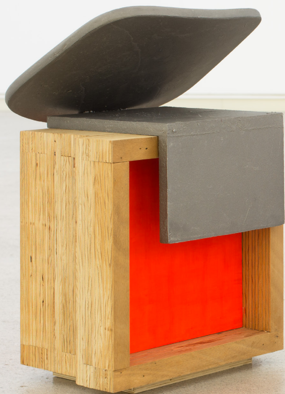
Mutante II , 2019 Kontraxapatua, soldatutako aluminiozko elementuak eta pintura. 53 x 37 x 28 cm.