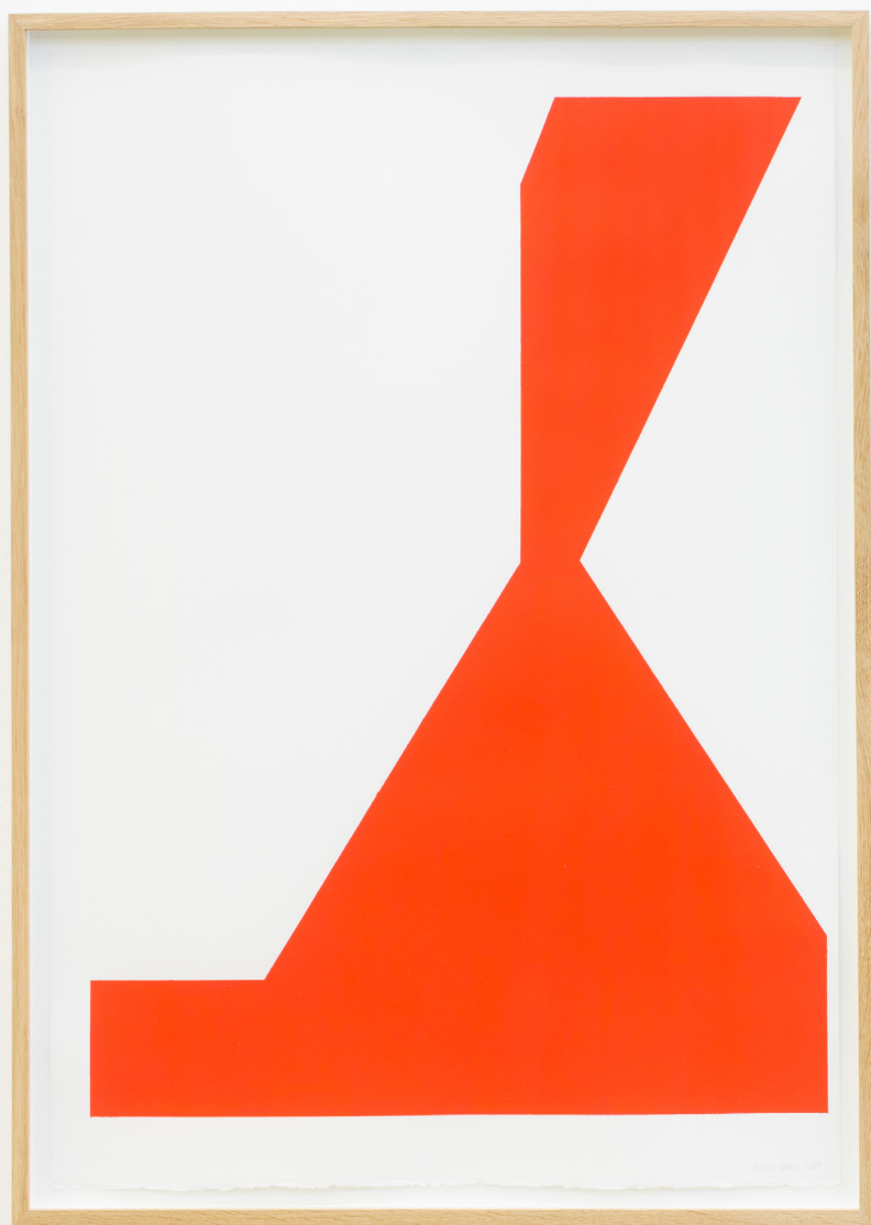
Sólido I, 2019 Pintura paper gainean. 100 x 70 cm.