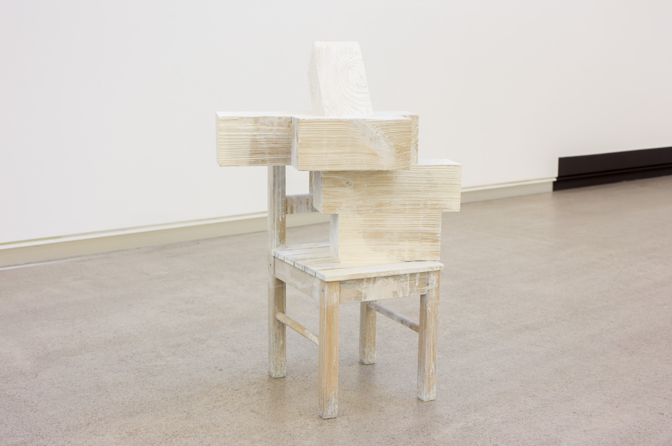
Bikote (zuria) , 2019 Egurrezko eraikuntza eta pintura. 62 x 52 x 34 cm.