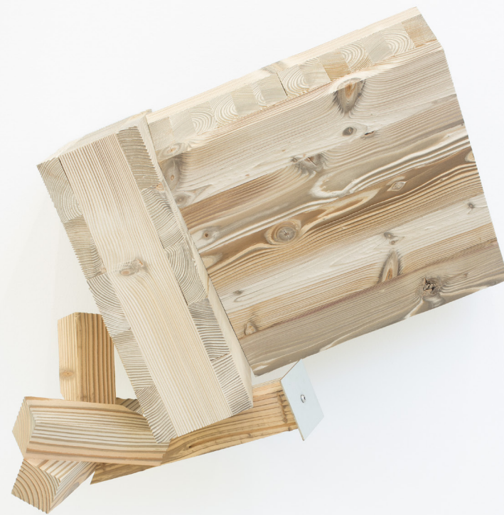
Titulo gabe, 2019. Egurrezko eraikuntza eta altzairu galvanizatua. 85 x 80 x 45 cm.