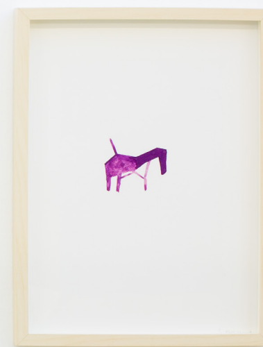
Bestiario V , 2019 Aquarela paper ganean. 40 x 30 cm.