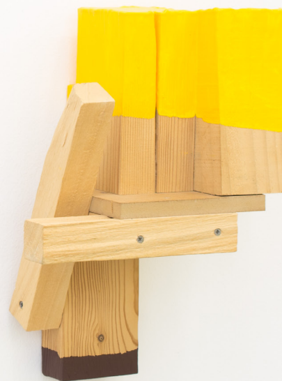
Saludo , 2019 Egurrezko eraikuntza eta pintura. 40 x 23 x 24,5 cm