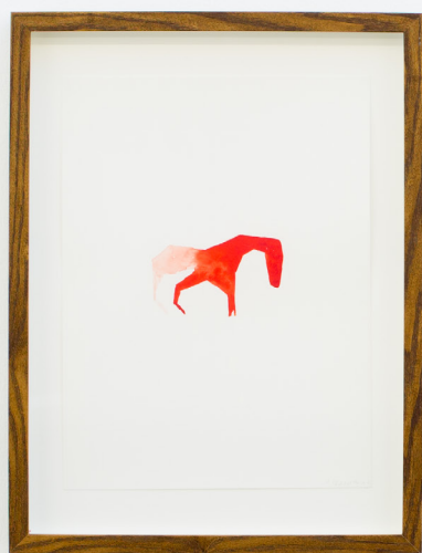
Bestiario II , 2019 Aquarela paper ganean. 40 x 30 cm.