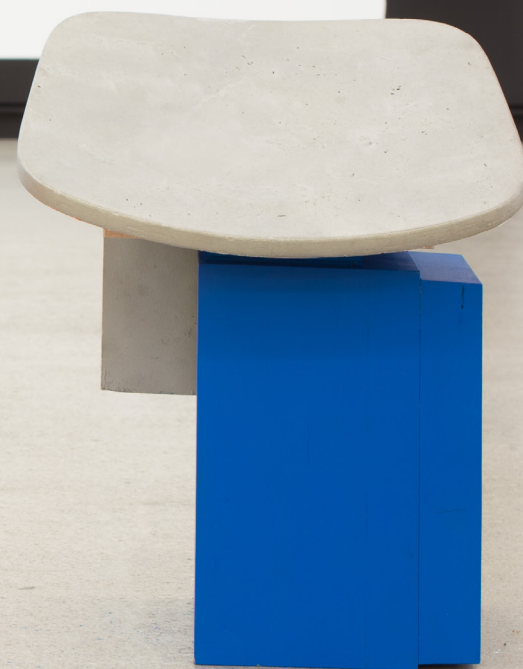
Mutante I , 2019 Galdatutako eta soldatutako aluminiozko elementuak, egurra eta pintura. 45 x 35 x 29 cm.