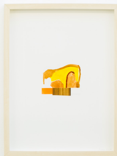
Bestiario IV , 2019 Aquarela paper ganean. 40 x 30 cm.