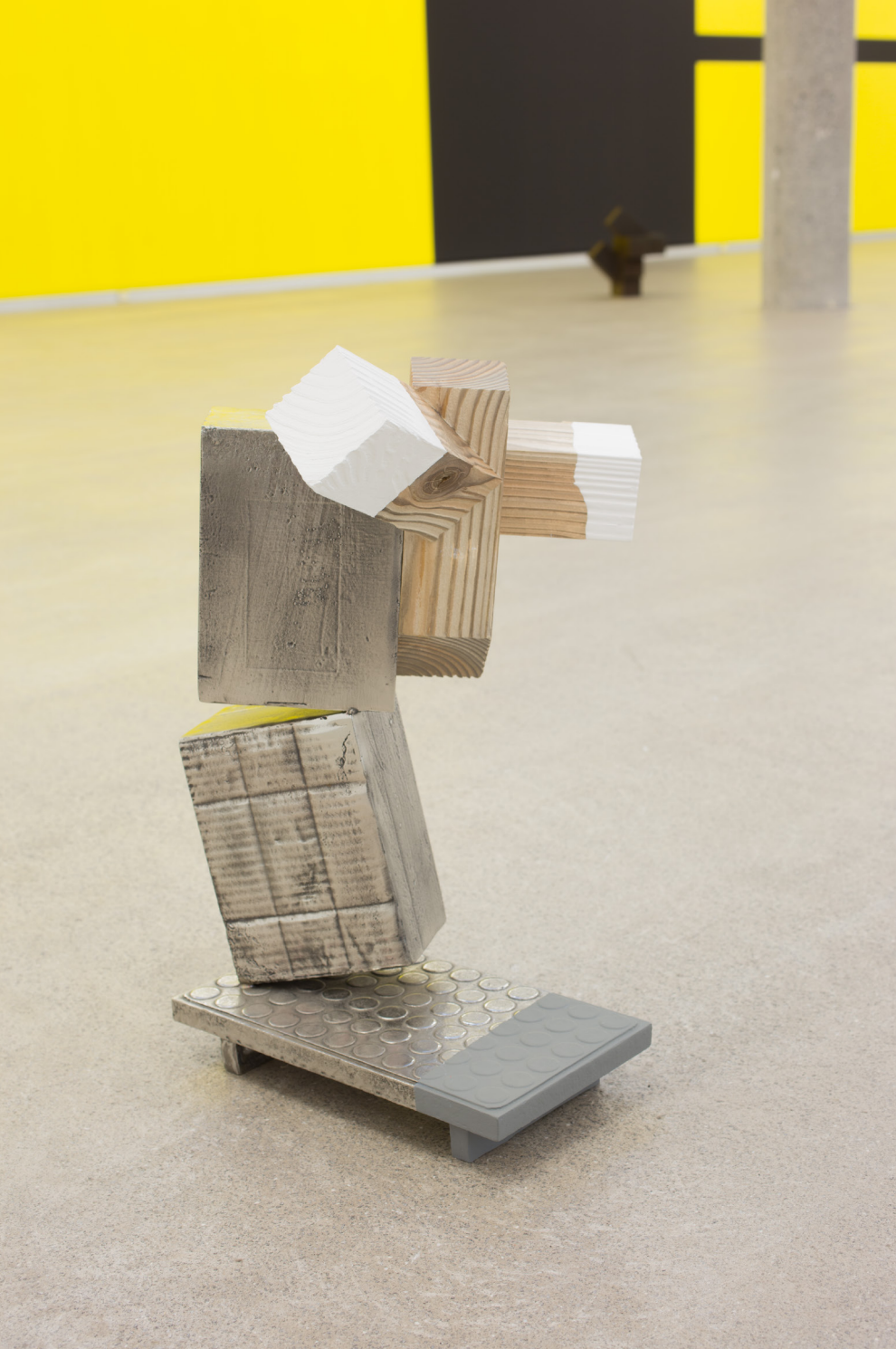
Dardara III , 2019. Galdatutako eta soldatutako altzairu herdoilgaitzezko elementuak, egurra eta pintura. 56,5 x 37 x 35 cm.