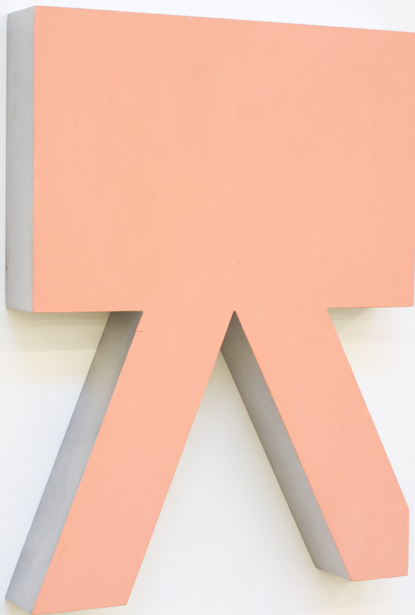
Sólido I (bunny) , 2019 Aluminio eta pintura. 40 x 30 x 5 cm.