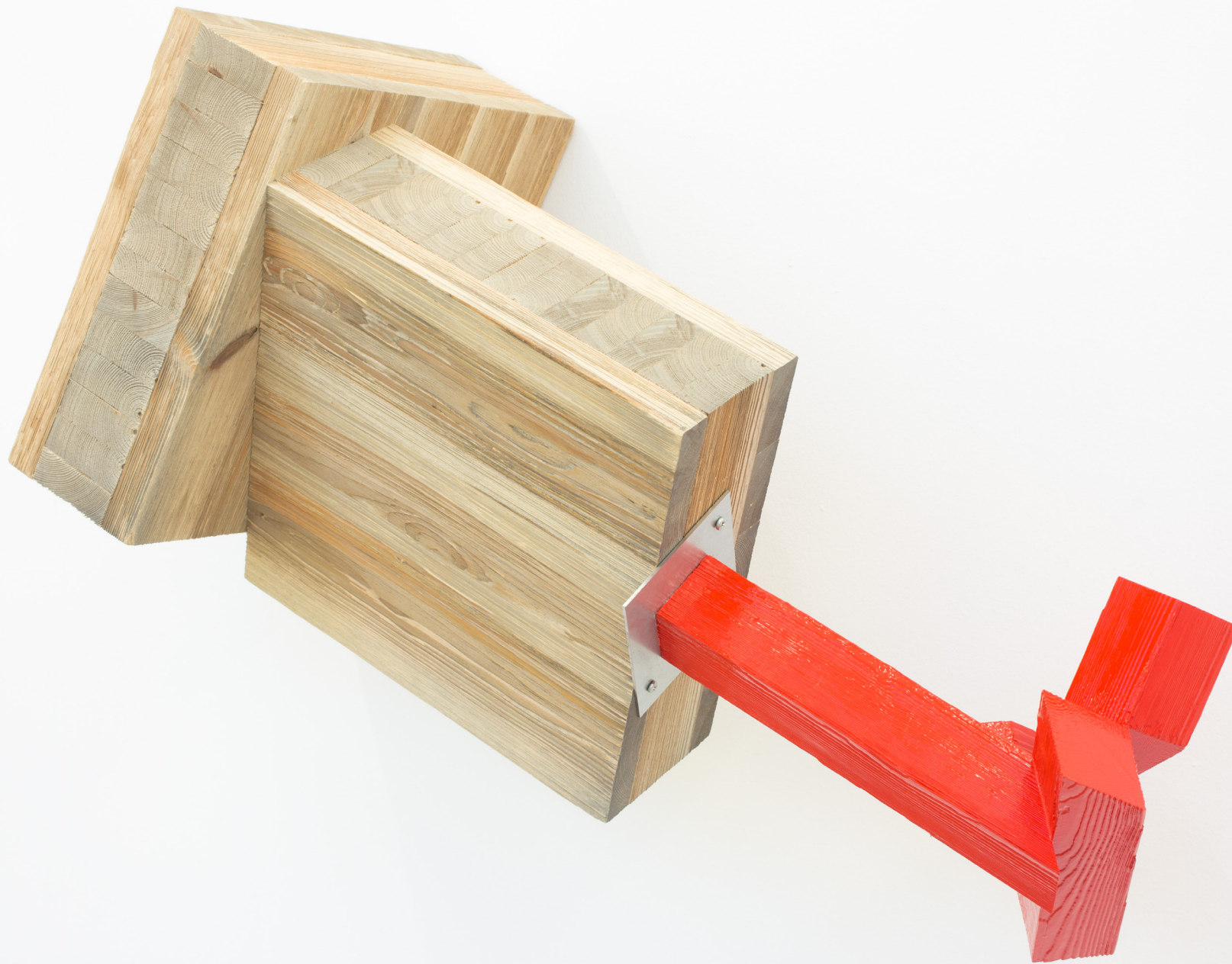
Titulo gabe, 2019. Egurrezko eraikuntza, altzairu galvanizatua eta pintura. 85 x 120 x 46 cm.