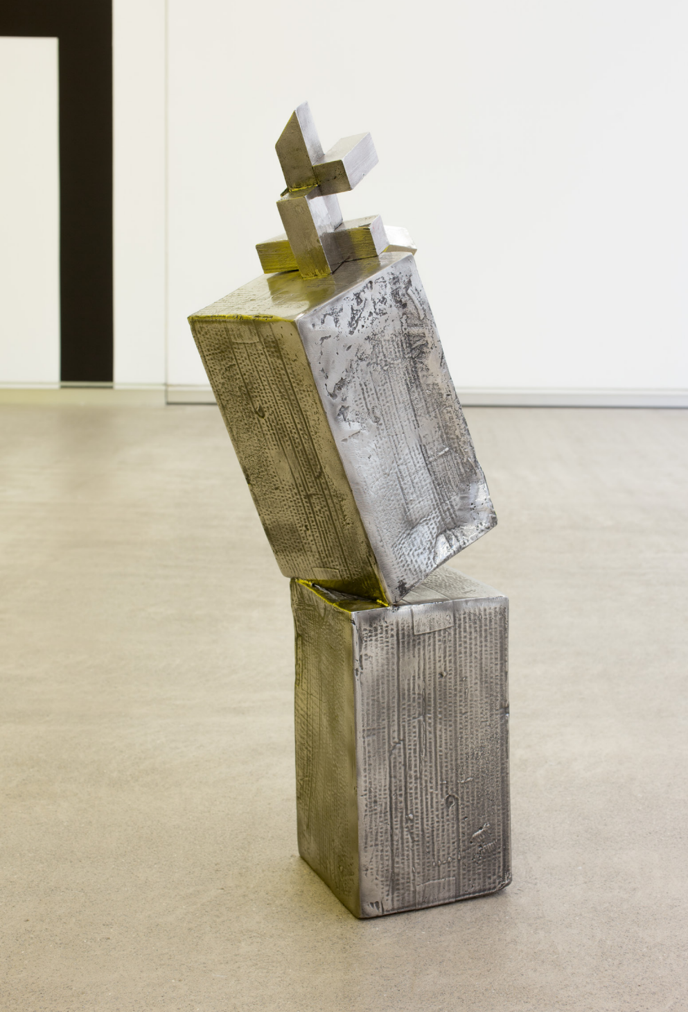
Ibiltari , 2019. Galdututako eta soldatutako altzairu herdoilgaitzezko elementuak eta pintura. 92 x 24 x 28 cm.