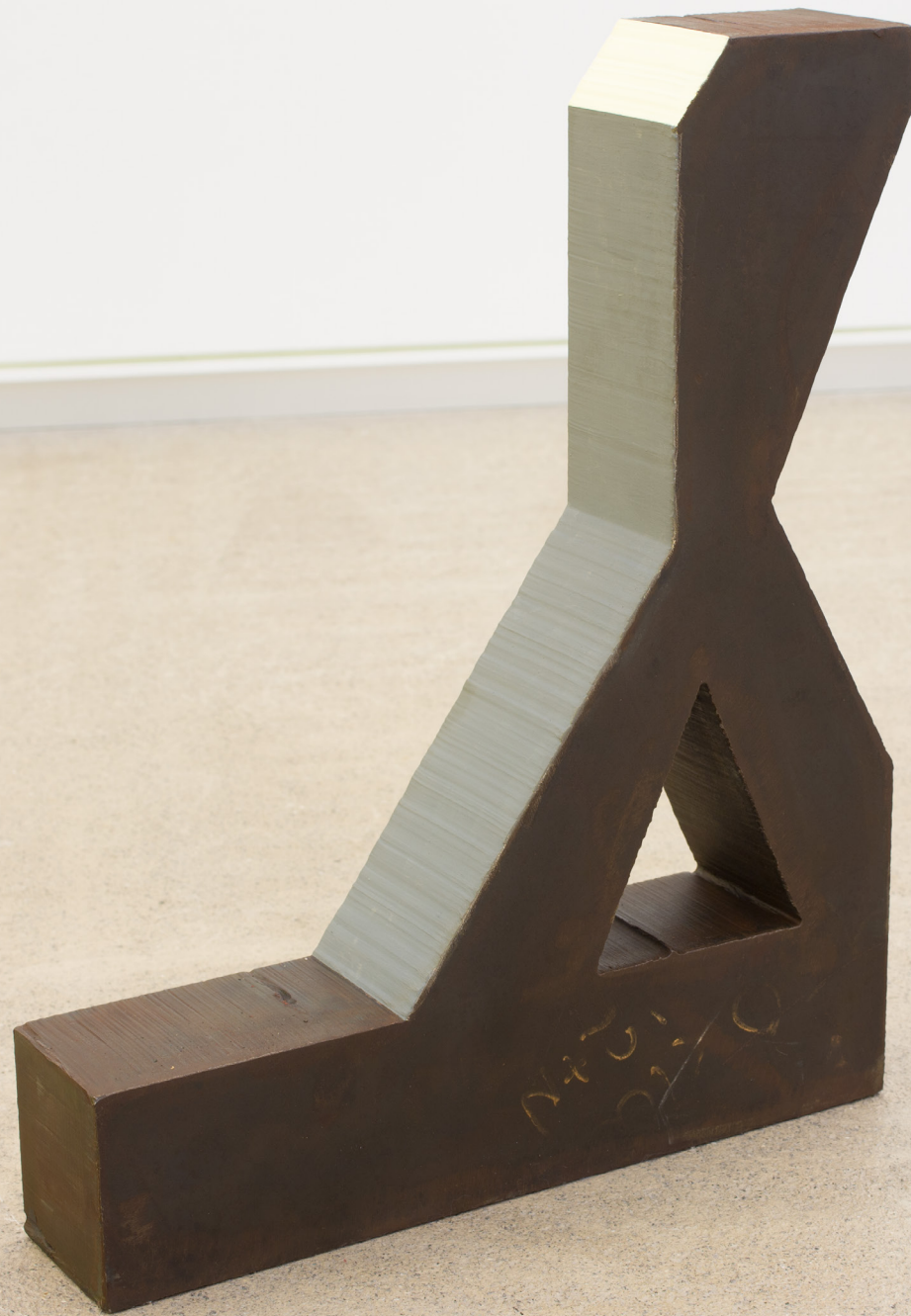
Sólido, 2019 Burdina eta pintura. 58,5 x 47 x 18 cm.