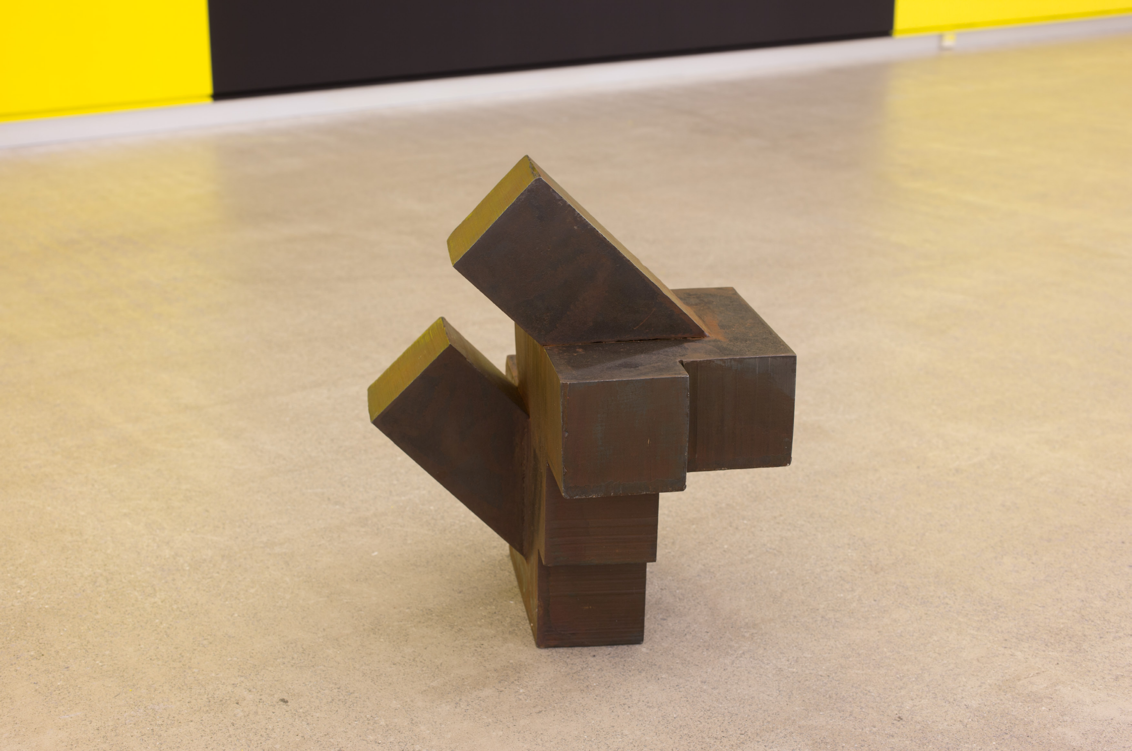
Bikote , 2019 Burdina. 44 x 39 x 38 cm.