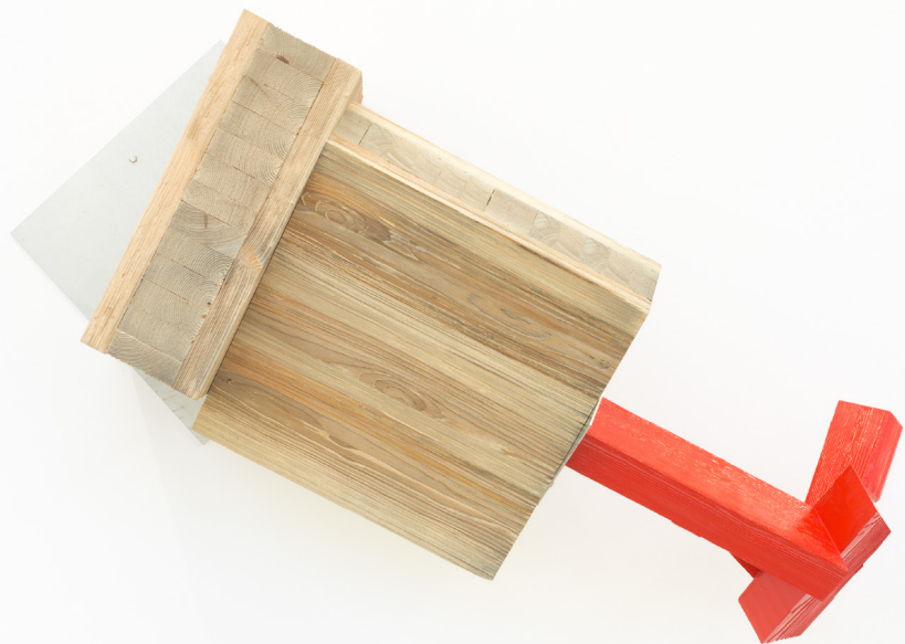
Titulo gabe, 2019. Egurrezko eraikuntza, altzairu galvanizatua eta pintura. 85 x 120 x 46 cm.