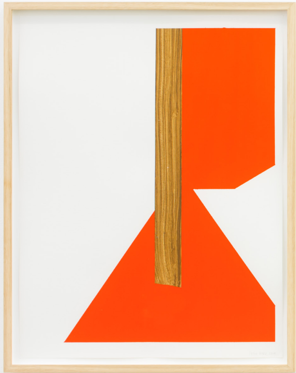
Abecedario III , 2019 Pintura eta collage paper gainea. 65 x 50 cm.