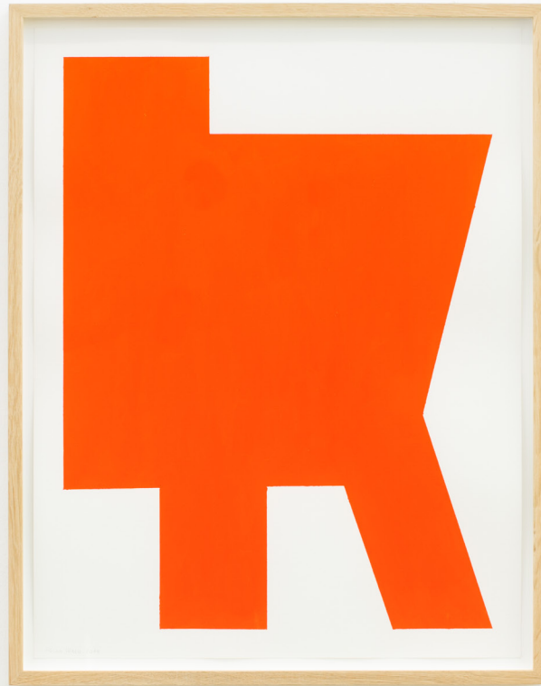
Abecedario I , 2019 Pintura eta collage paper gainea. 65 x 50 cm.