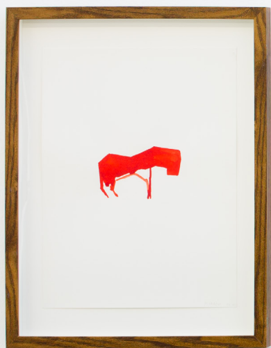
Bestiario III , 2019 Aquarela paper ganean. 40 x 30 cm.