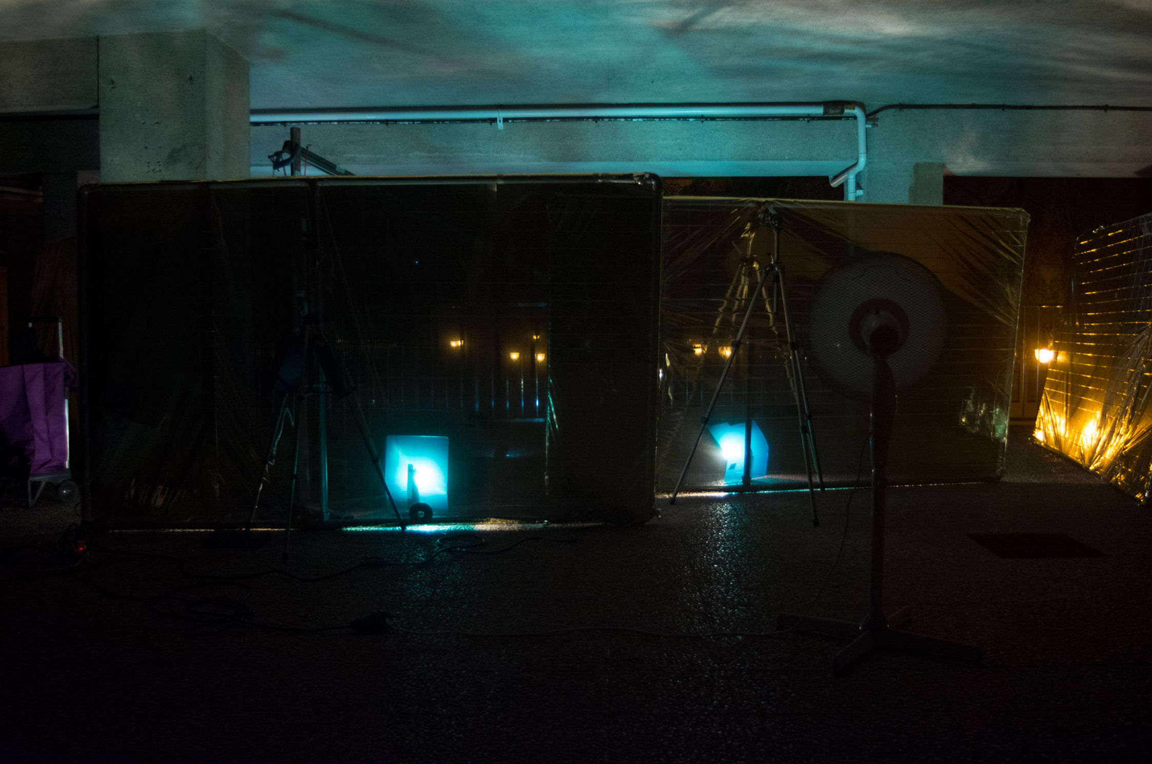
Fantasías de Pólvora 8 , 2020. Fotografía digital. 50 x 70 cm.