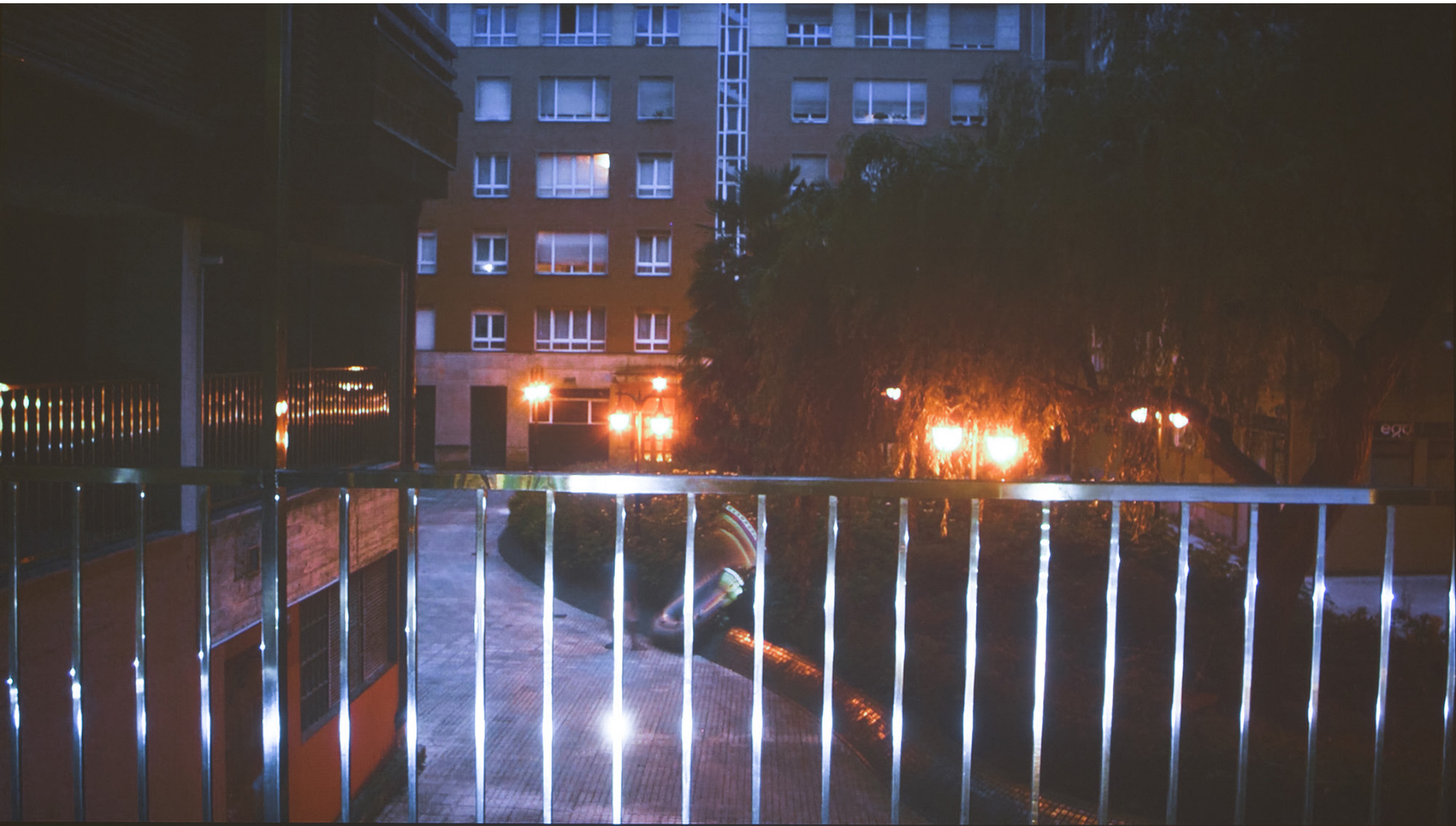
EXCURSION3 , 2020. Video HD. 28'.