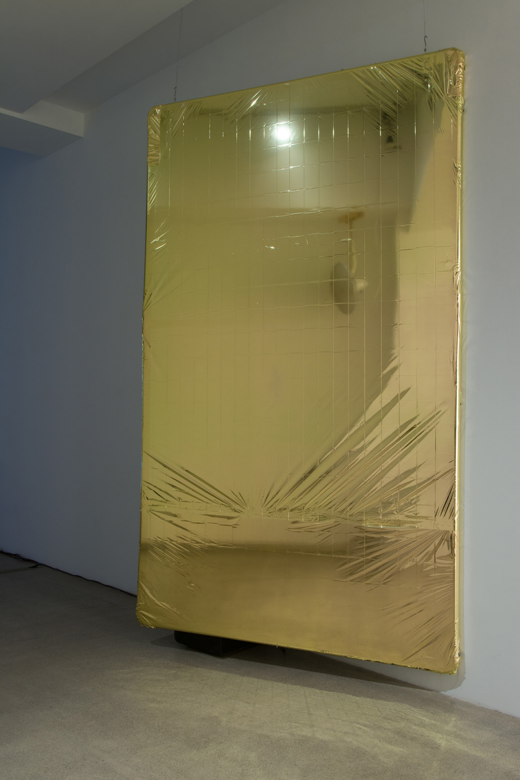
Sin título, 2020 PVC, manta de supervivencia 92% (Polietileno tereftalato (PET), 4% aluminio, 4% resina). 275,5 x 155 x 6 cm.