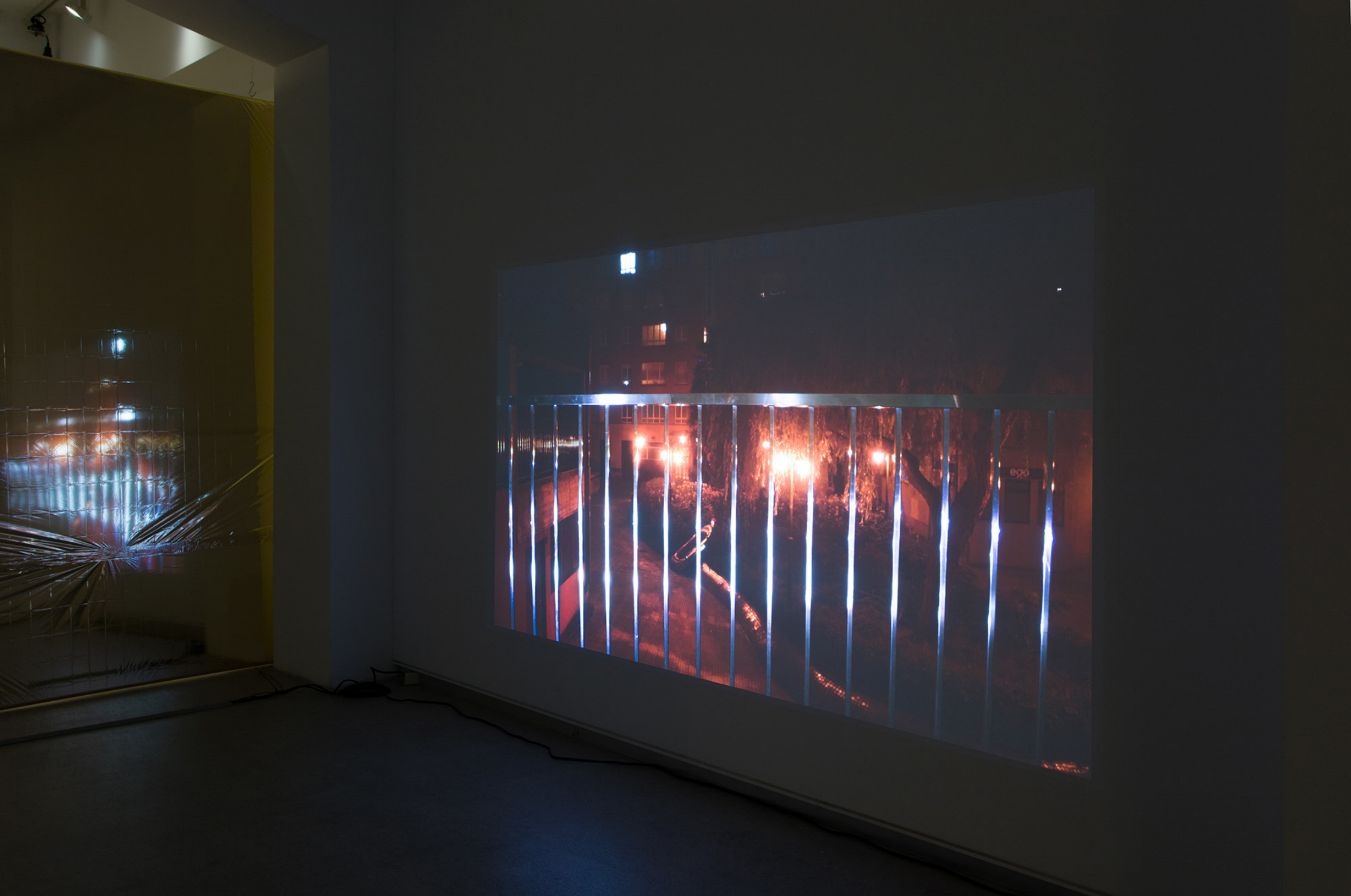
EXCURSION3 , 2020. HD bideoa. 28'.