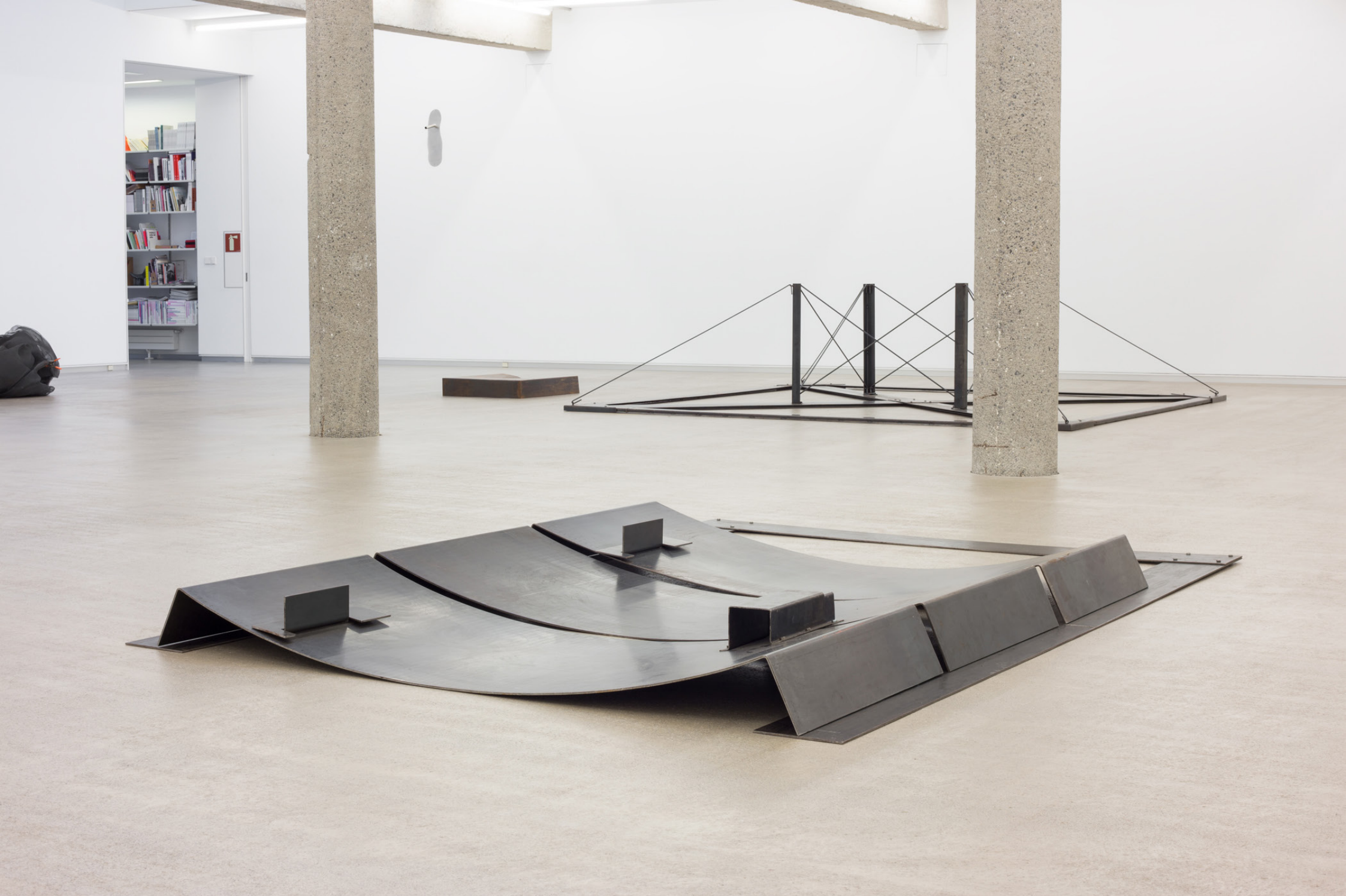
Once-diecinueve-quince , 1992. Burdina. 16 x 290,5 x 197,5 cm.