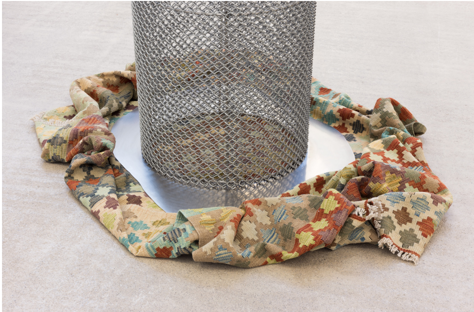
Encima de alfombra , 2000. Altzairu herdoilgaitza eta alfombra 223 x 140 x 120 cm.