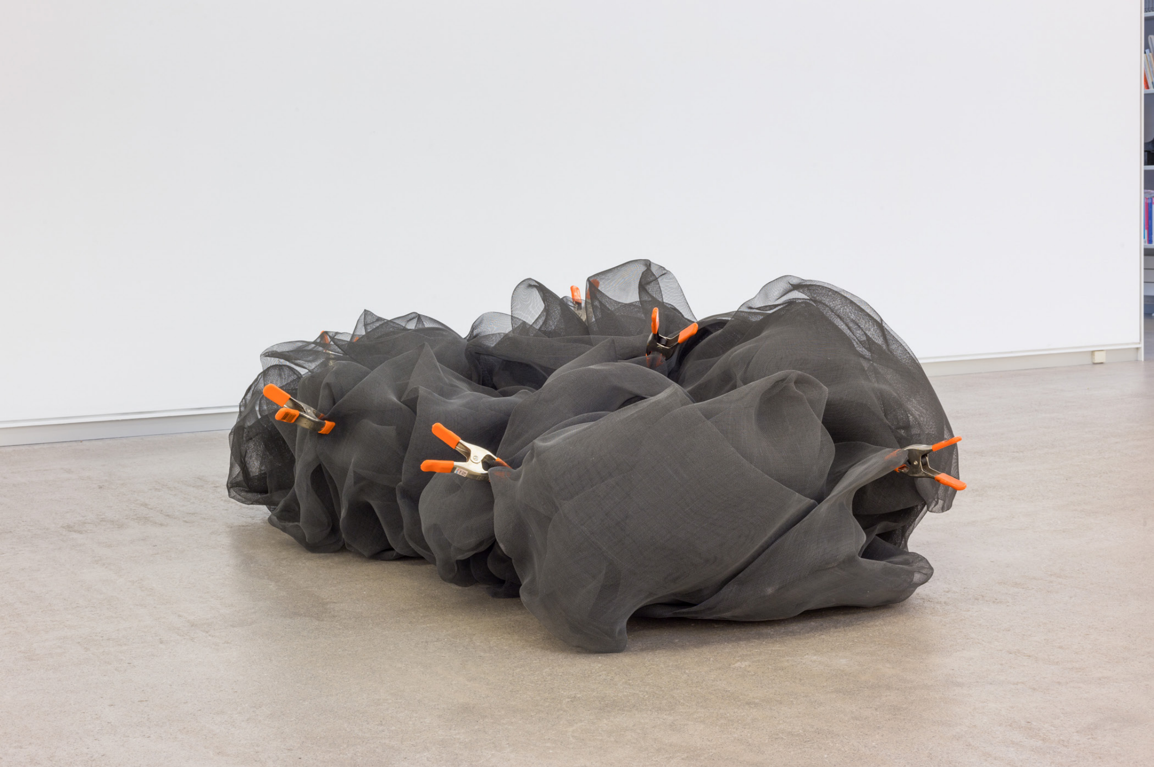
Kapokier , 1997. Ehun metalikoa eta pintzak. 62 x 192 x 133 cm.