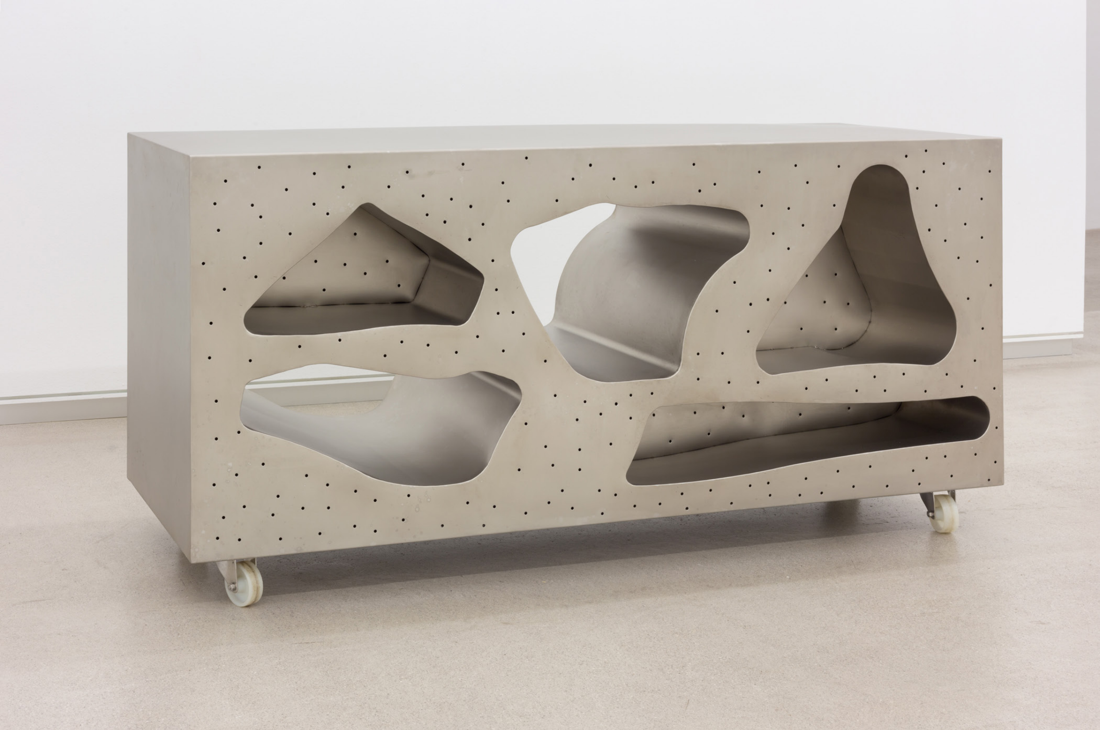
Footprints n°1 , 2014. Altzairu erdoilgaitza. 85,5 x 180,5 x 55 cm.