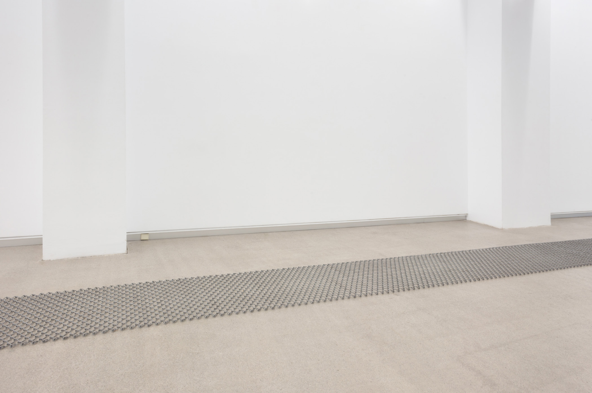
Rock and roll , 1999. Ehun metalikoa eta beira. Neurri aldakorrak. (xehetasuna)