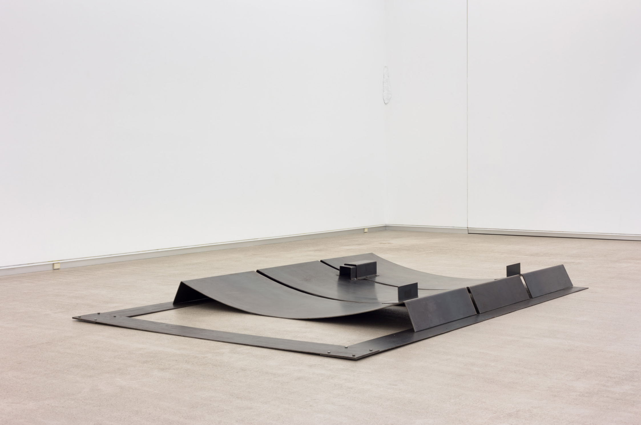
Once-diecinueve-quince , 1992. Burdina. 16 x 290,5 x 197,5 cm.