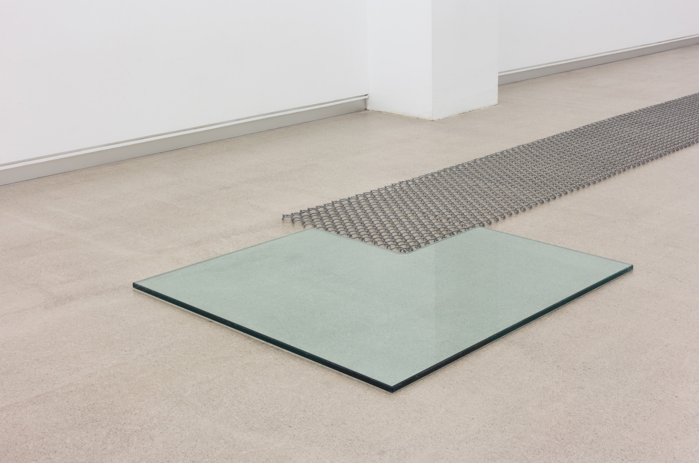
Rock and roll , 1999. Ehun metalikoa eta beira. Neurri aldakorrak. (zehetasuna)