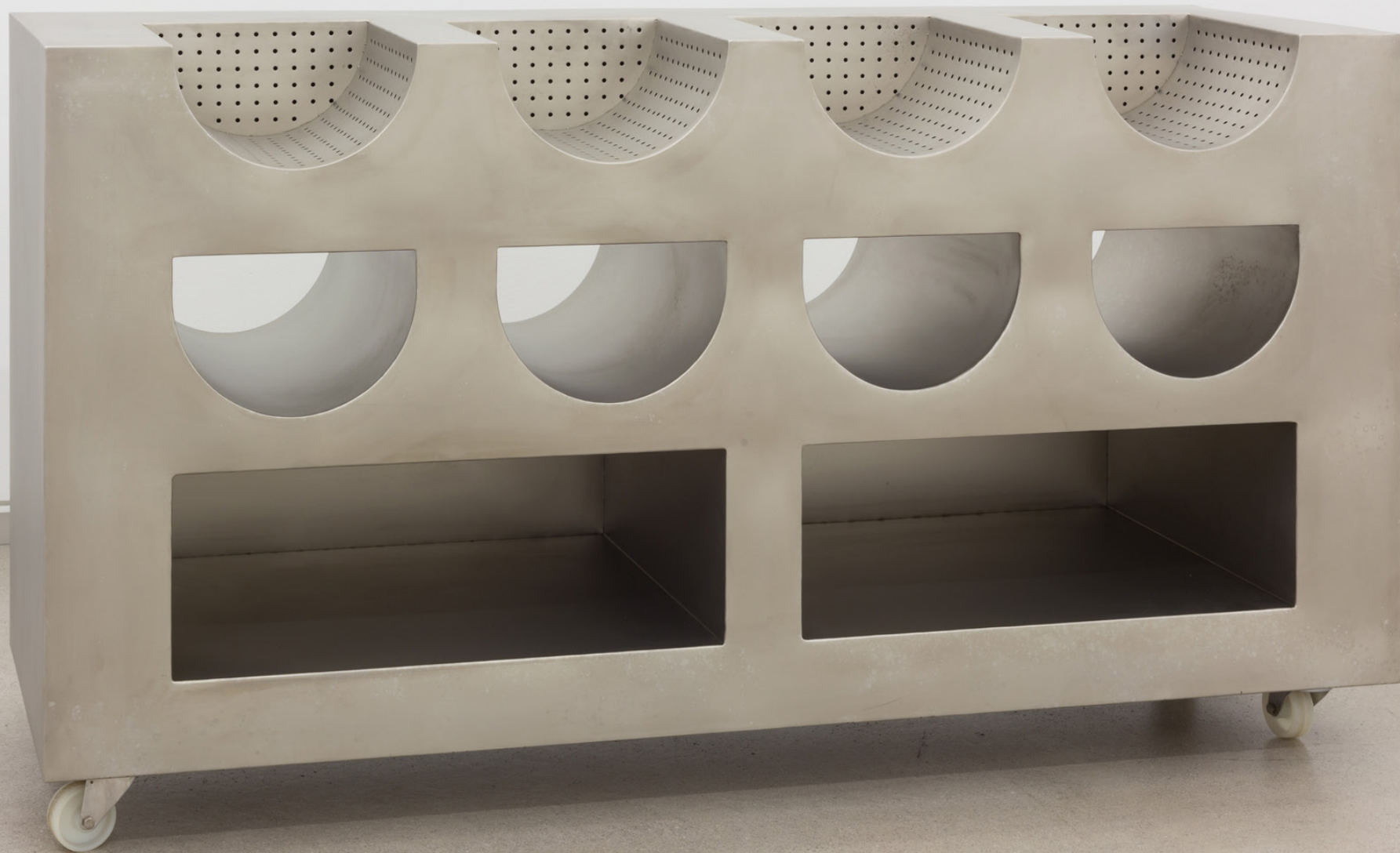
Footprints n°2 , 2014. Altzairu erdoilgaitza. 98,5 x 180 x 55 cm.