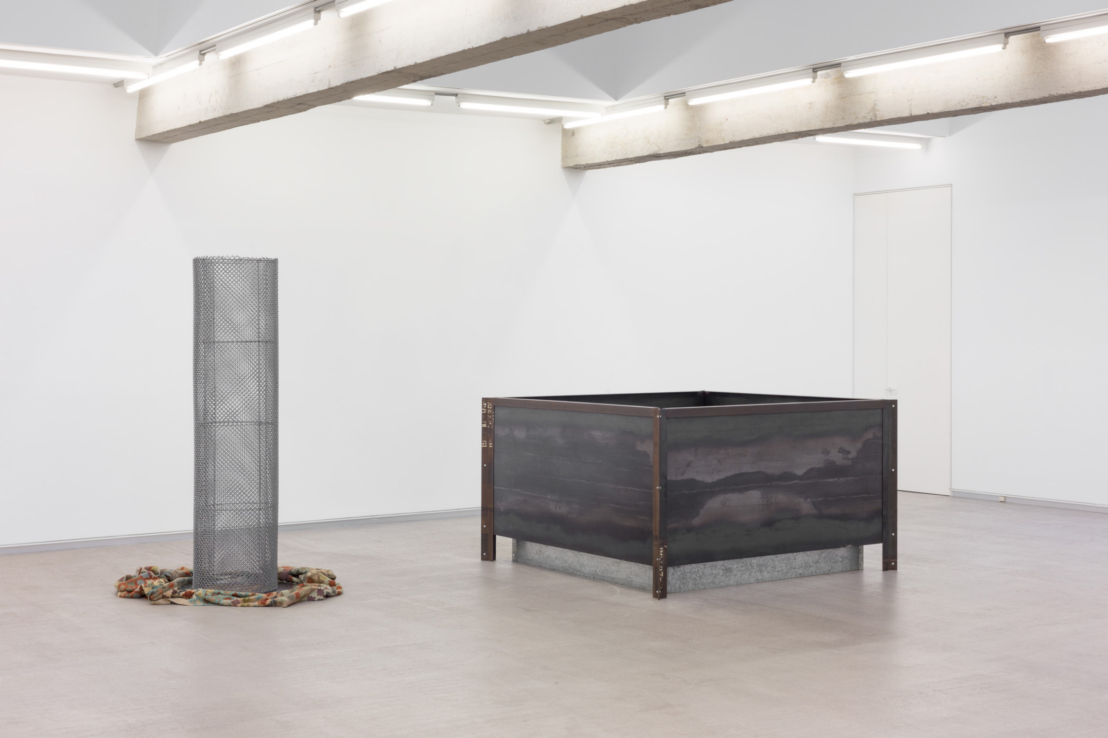
Encima de alfombra , 2000. Altzairu herdoilgaitza eta alfombra. 223 x 140 x 120 cm.