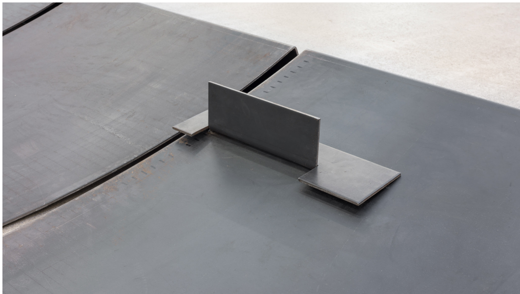
(goian) Once-diecinueve-quince , 1992 (xehetasuna) Burdina 16 x 290,5 x 197,5 cm.