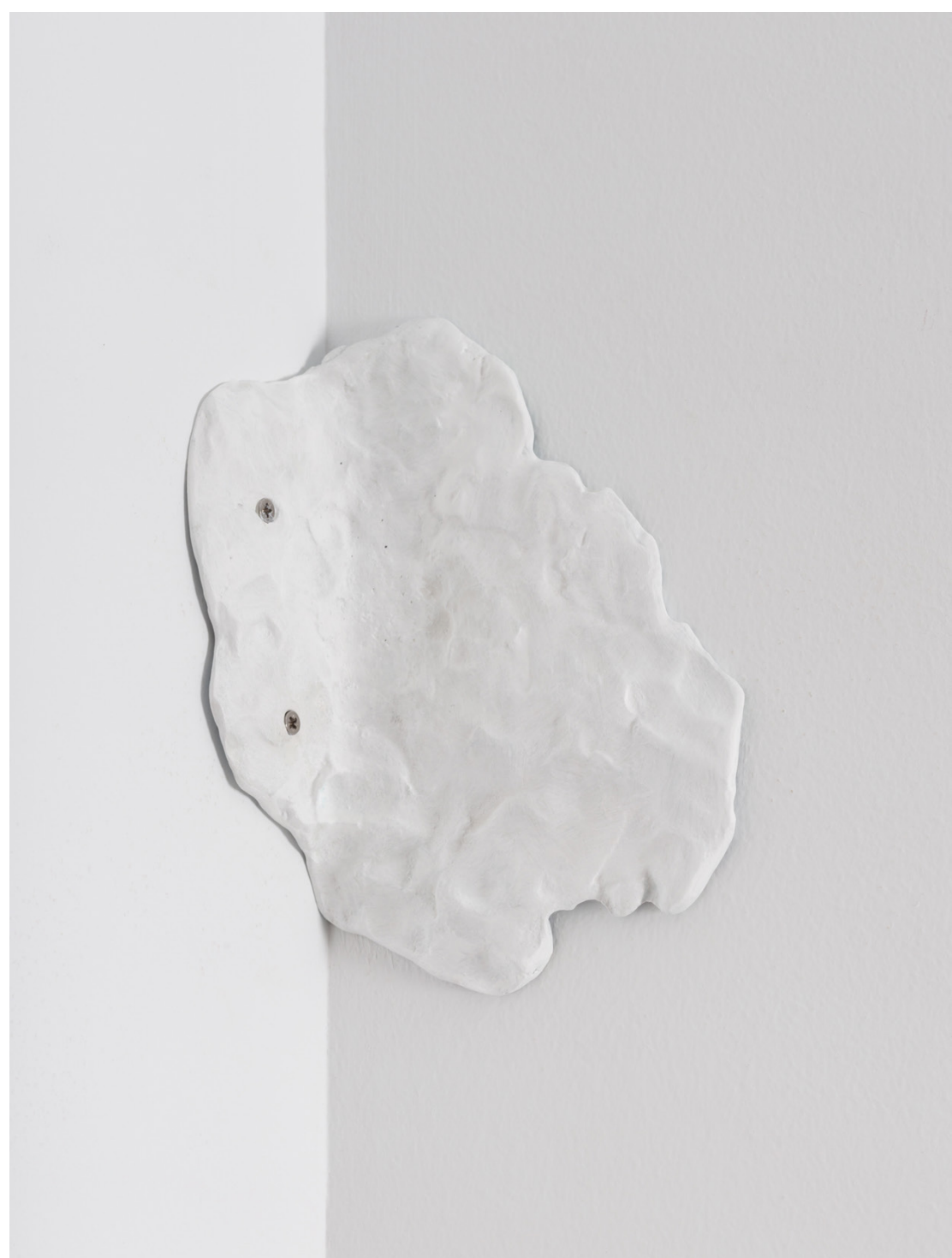
Huella de rincón I , 2023. Brontze margotua. 22 x 15 x 7,5 cm.