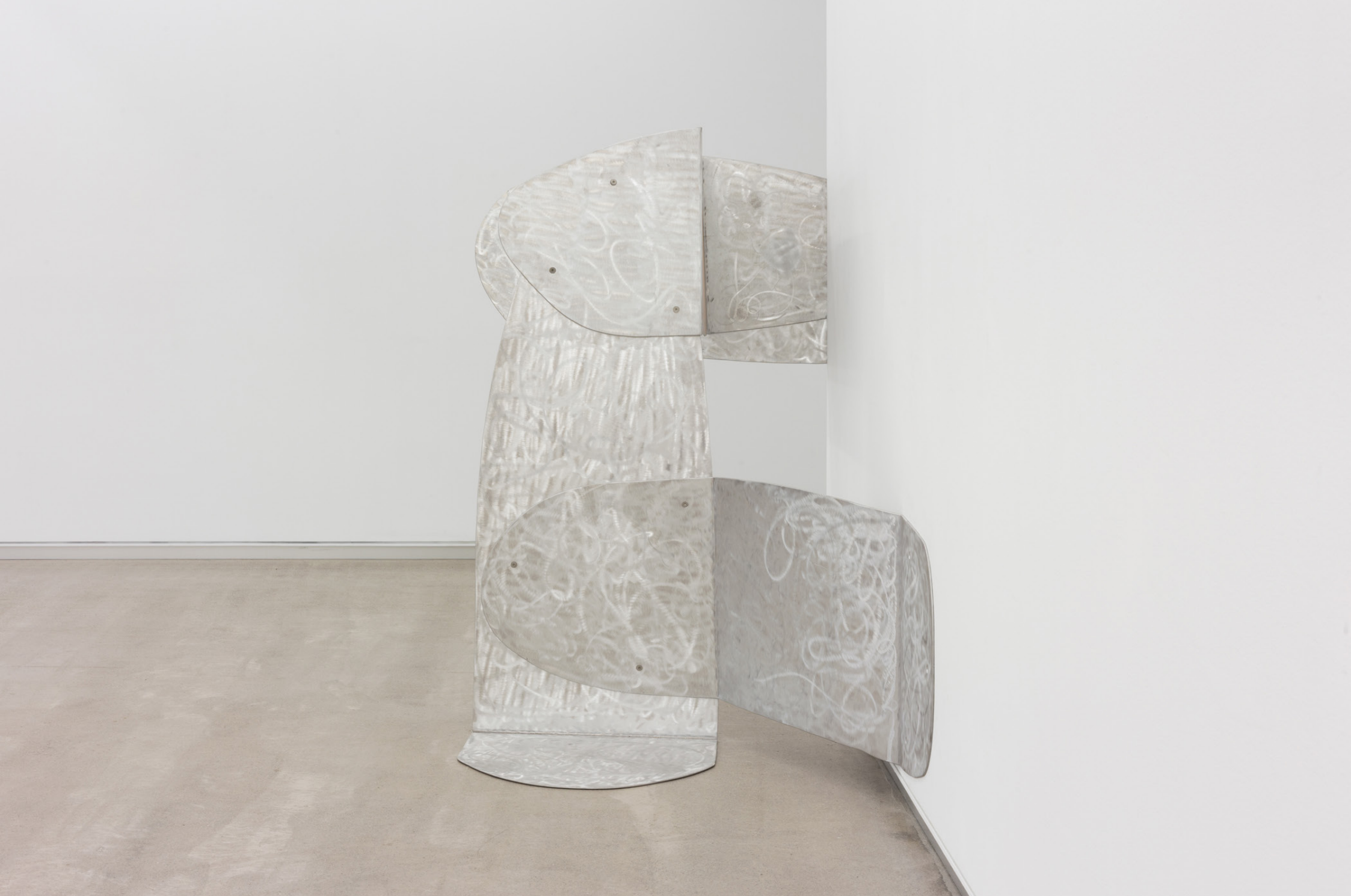
La negación , 2001. Aluminio magnesio. 158 x 212 x 153 cm.