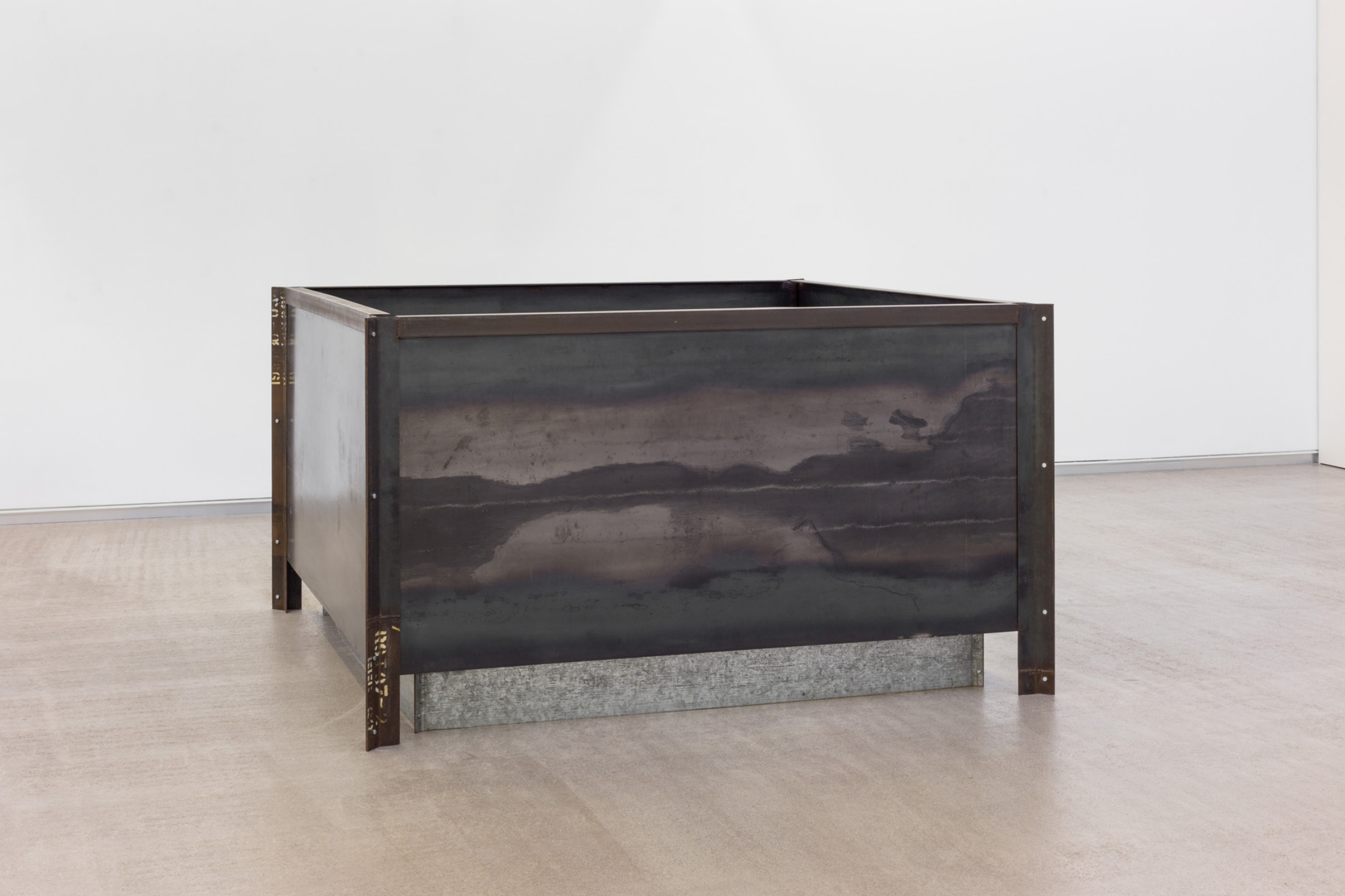
Montblanquet , 1988. Burdina eta agregakina. 122 x 216 x 216 cm.