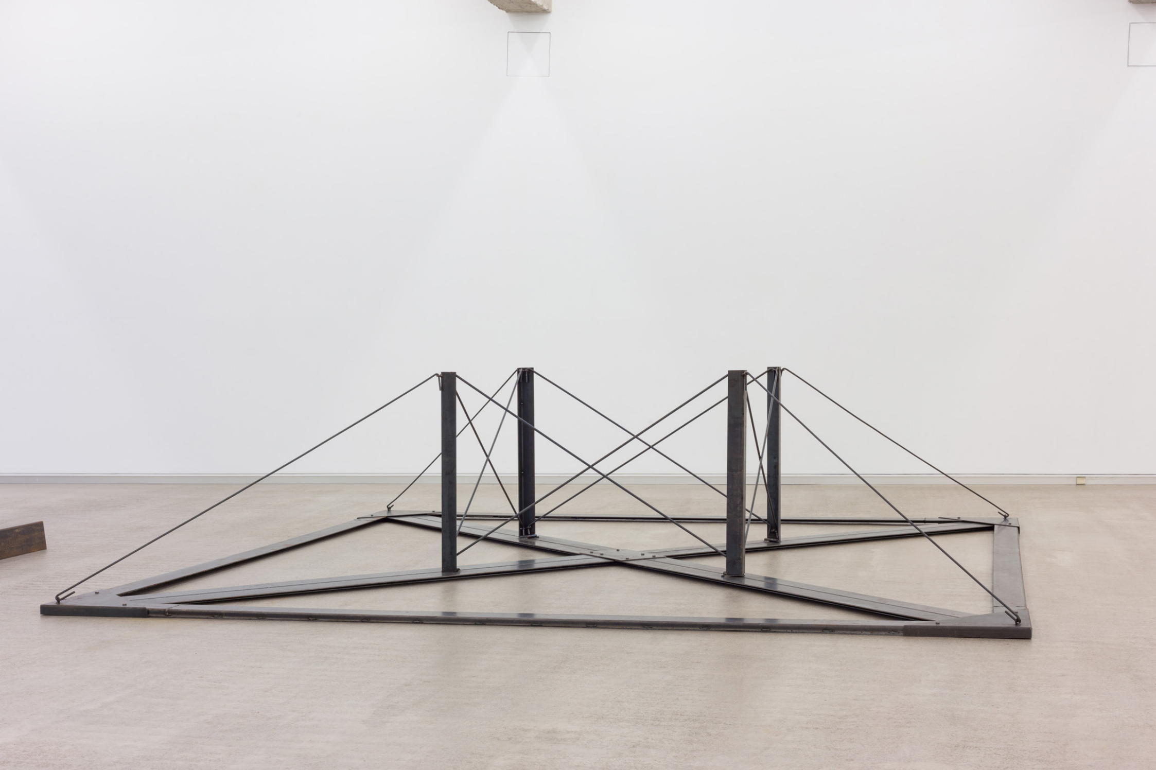
El lugar donde volvió, 1998. Burdina. 90,5 x 271 x 371 cm.