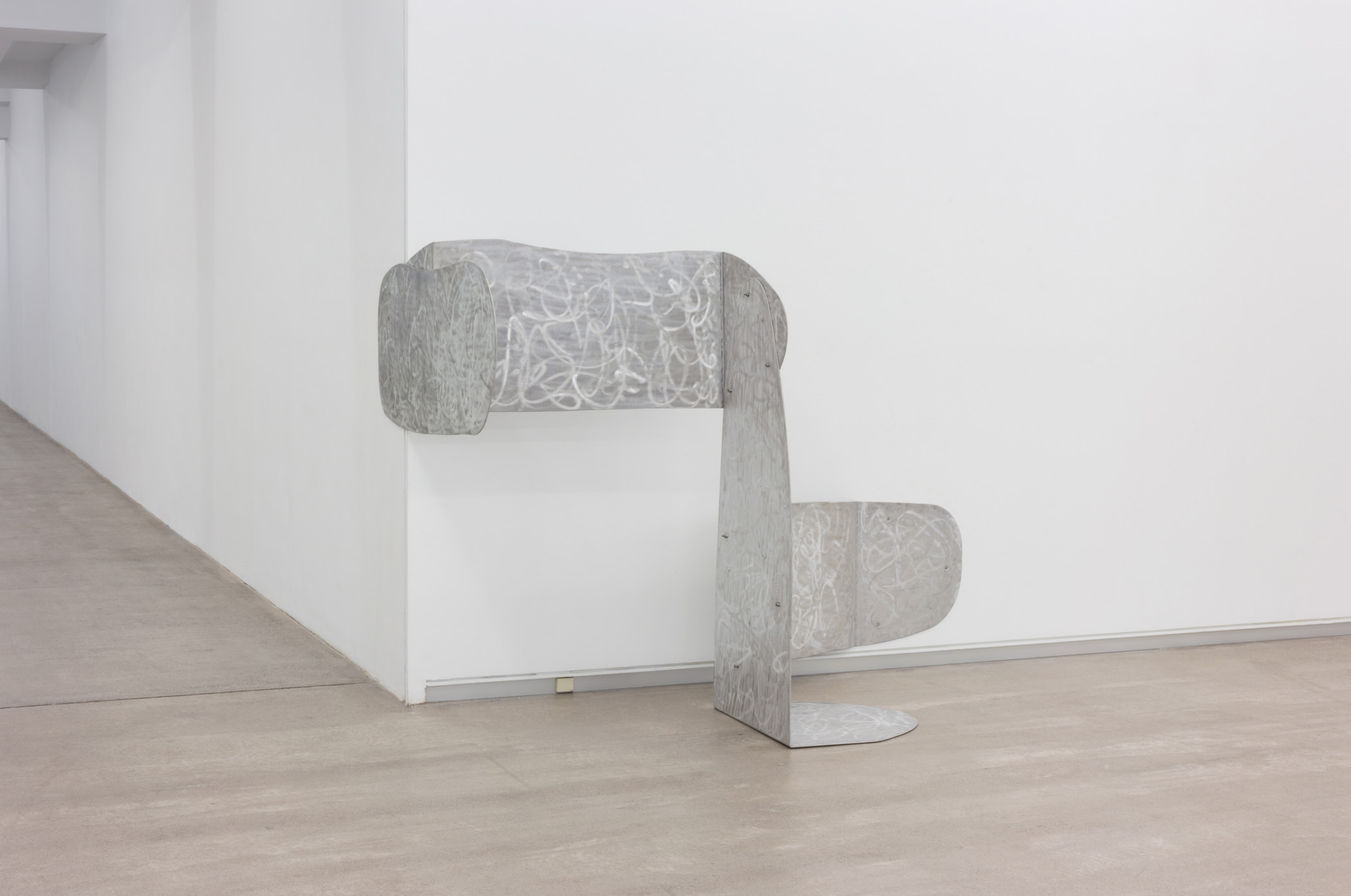
La negación , 2001. Aluminio magnesioa. 158 x 212 x 153 cm.