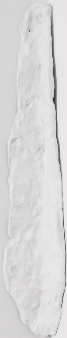
Huella de rincón II, 2023 Brontze margotua 50 x 7 x 8 cm.