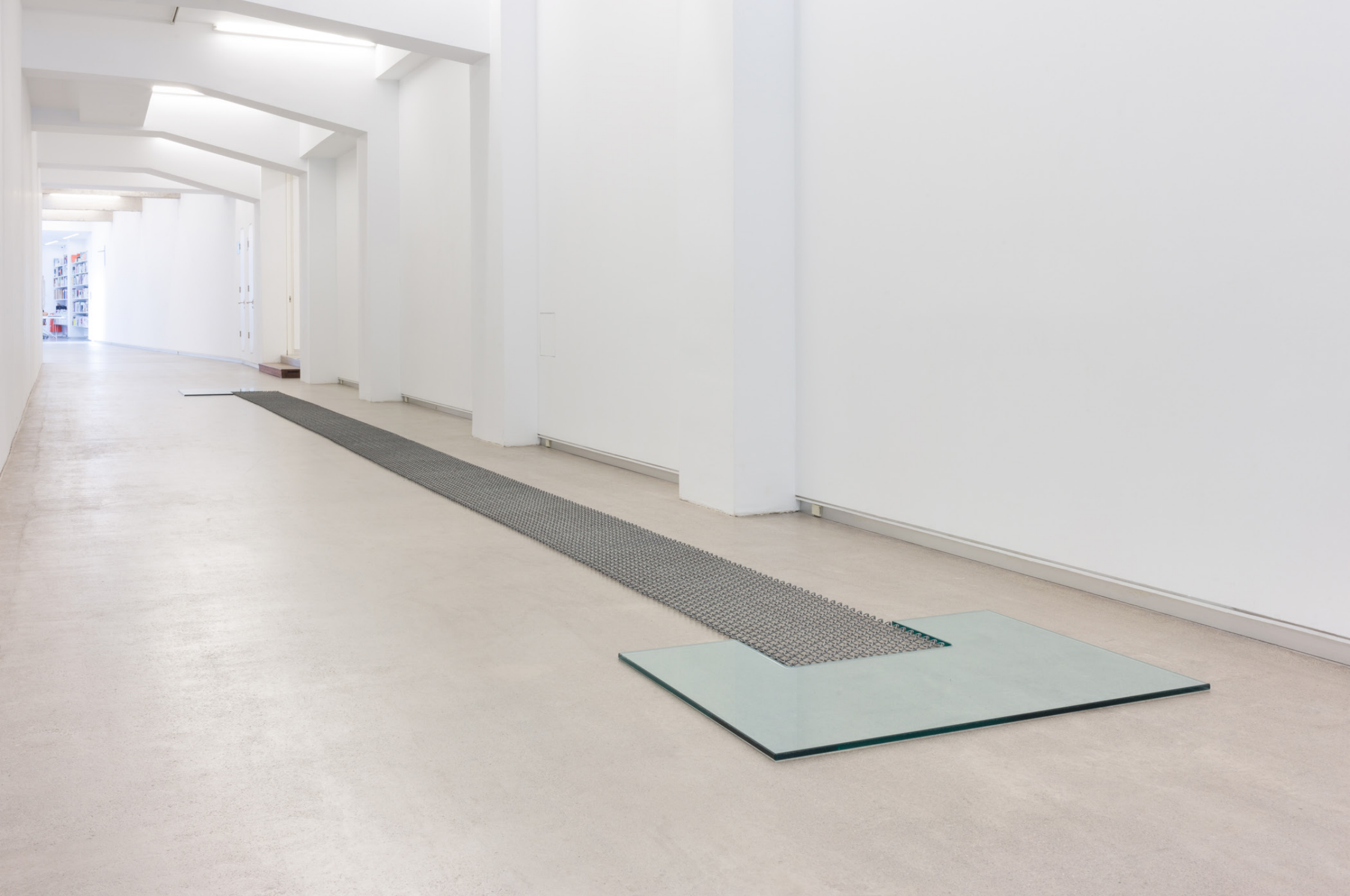
Rock and roll , 1999. Ehun metalikoa eta beira. Neurri aldakorrak.