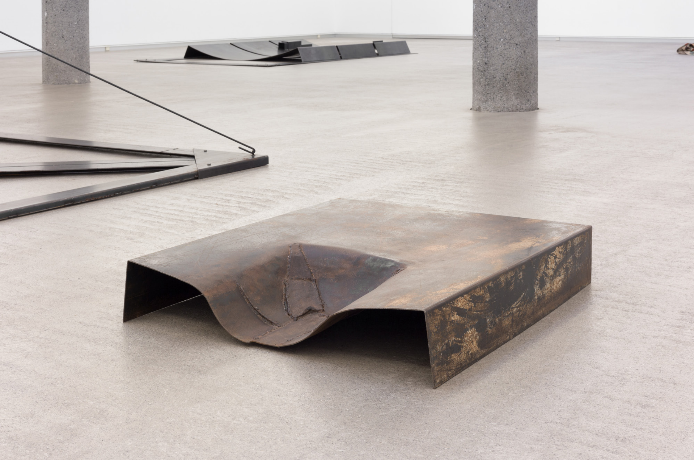
Esfinx II , 1983. Burdina. 15 x 86 x 75 cm.