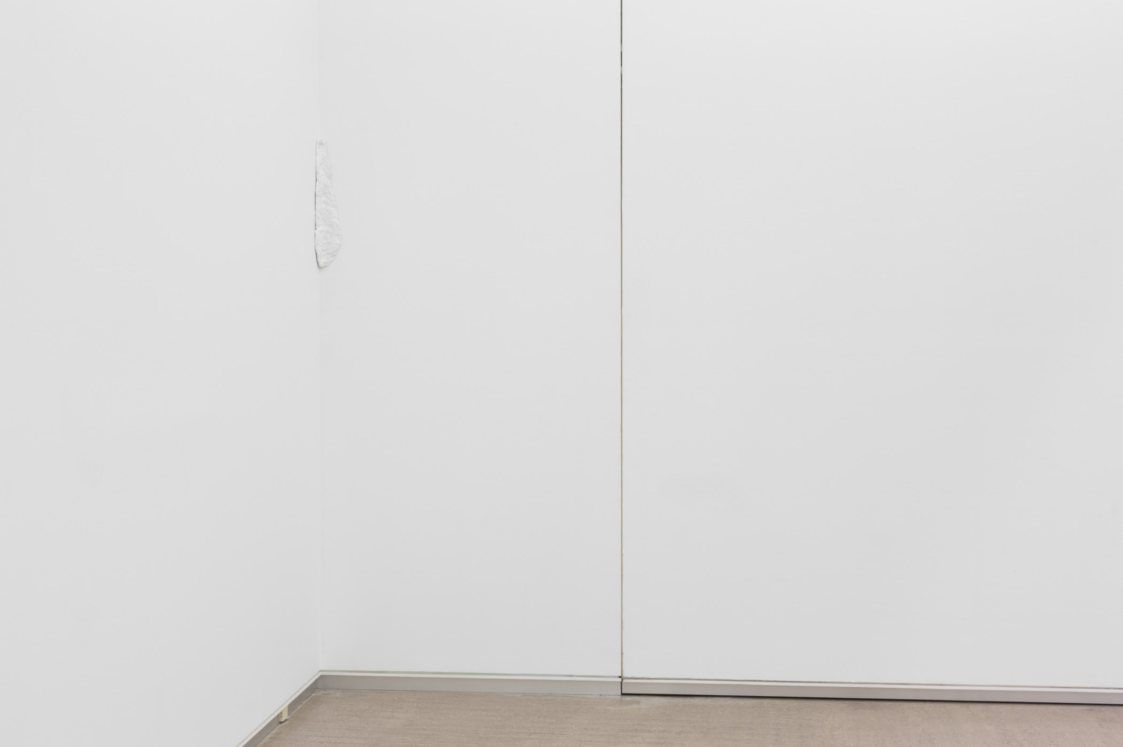
Huella de rincón II , 2023. Brontze margotua. 50 x 7 x 8 cm.