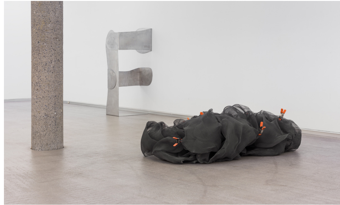
(goian) Kapokier , 1997 Ehun metalikoa eta pintzak 62 x 192 x 133 cm.