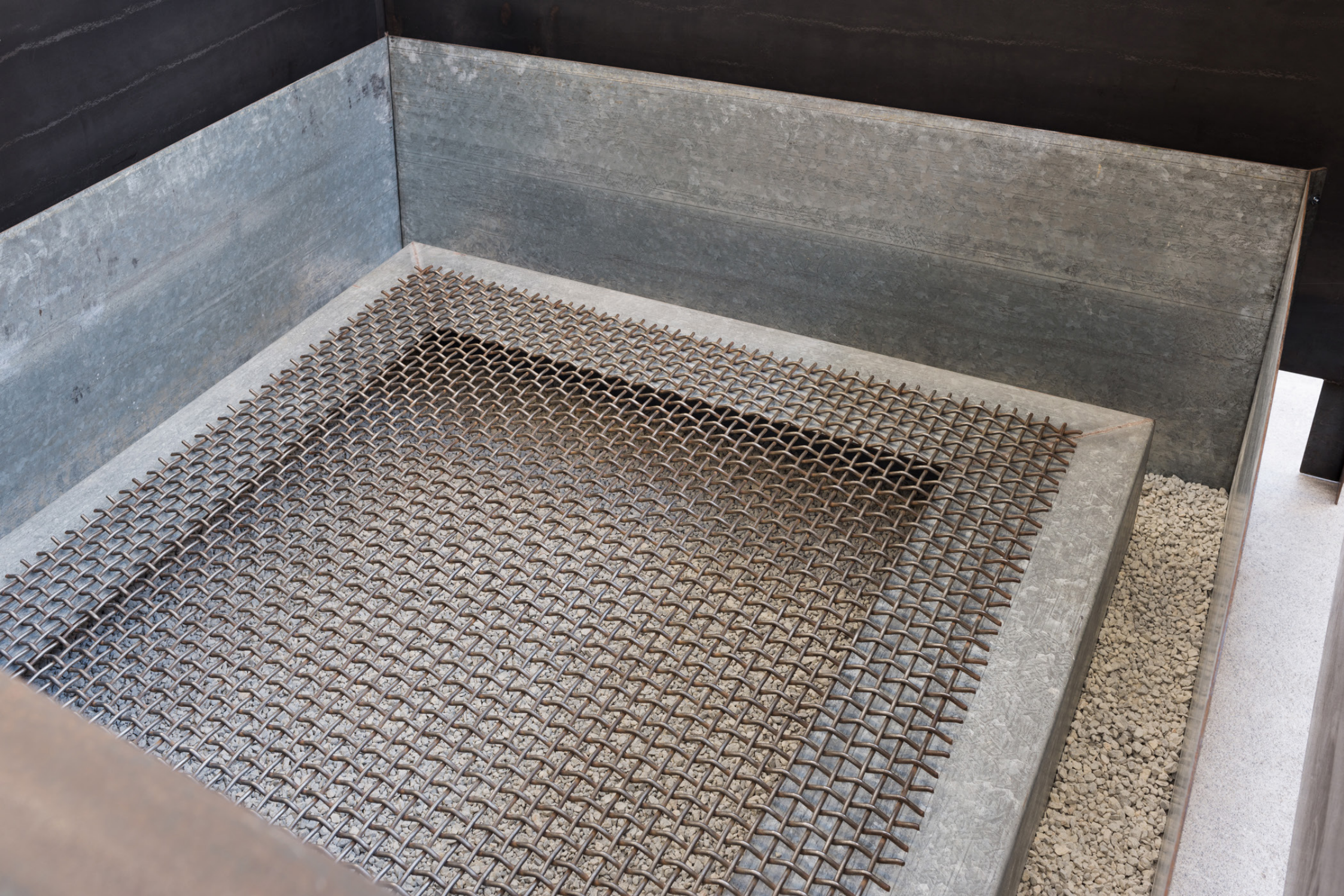
Montblanquet, 1988. Burdina eta agregakina. 122 x 216 x 216 cm. (xehetasuna)