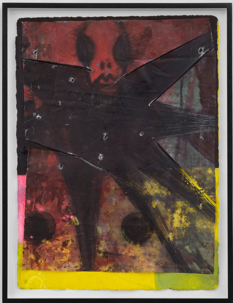
Estrella , 2023. Acrílico y tinta sobre plástico y papel. 75 x 56 cm.