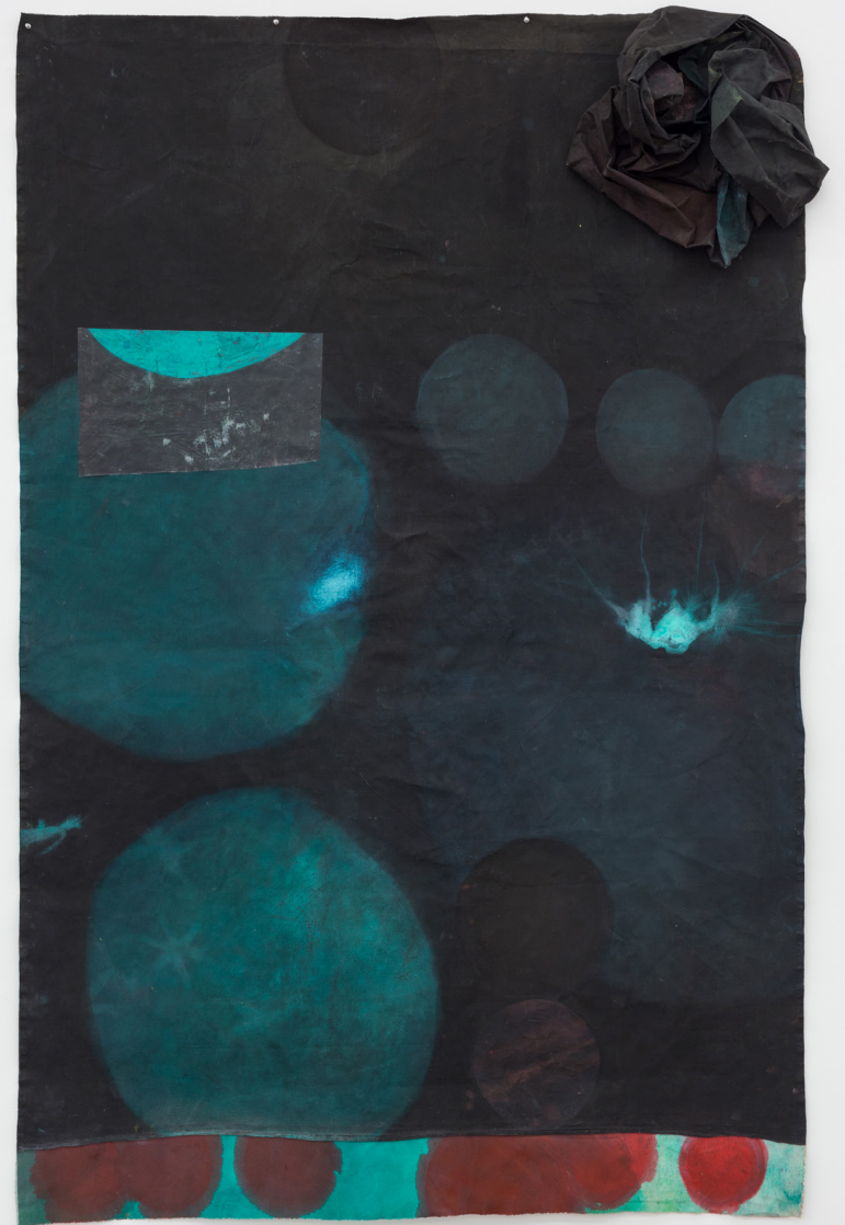
Flor negra , 2023. Acrílico y tinta sobre tela. 225 x 154 cm.