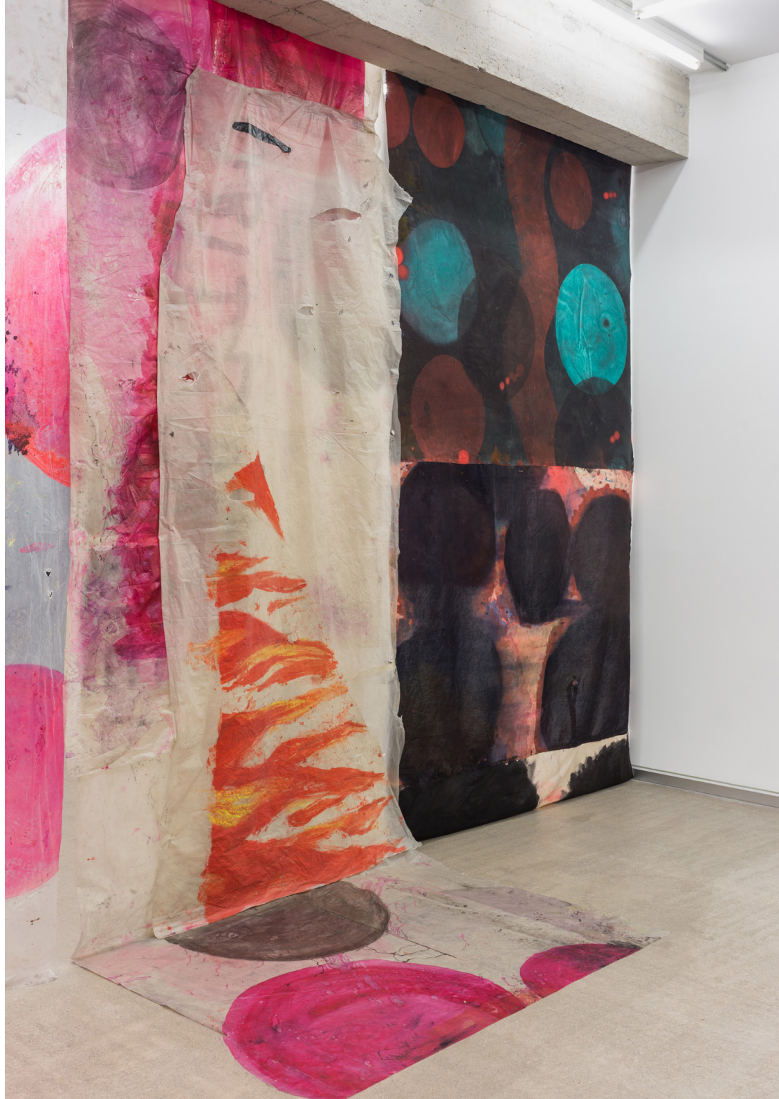
Cortinone 2, 2023 (detalle) Tinta, óleo y acrílico sobre tela y plástico. Medidas variables