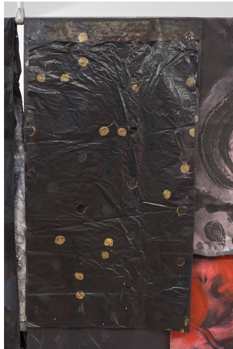
(arriba) Cortinone 3 , 2023 (detalle) Tinta, óleo y grafito sobre tela y plástico. Medidas variables