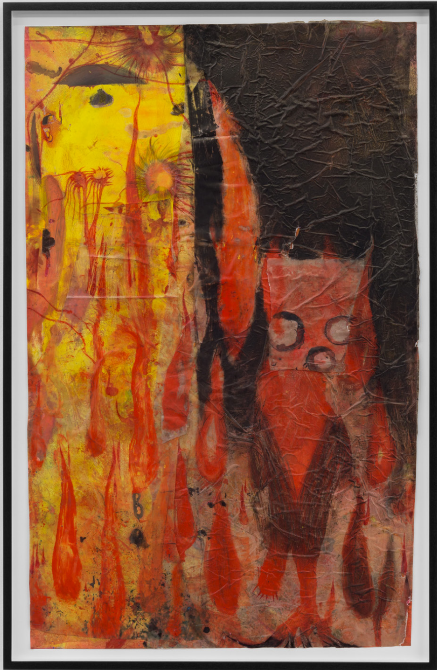
Pollo frito , 2022. Óleo y bolígrafo sobre plástico. 108 x 67 cm.