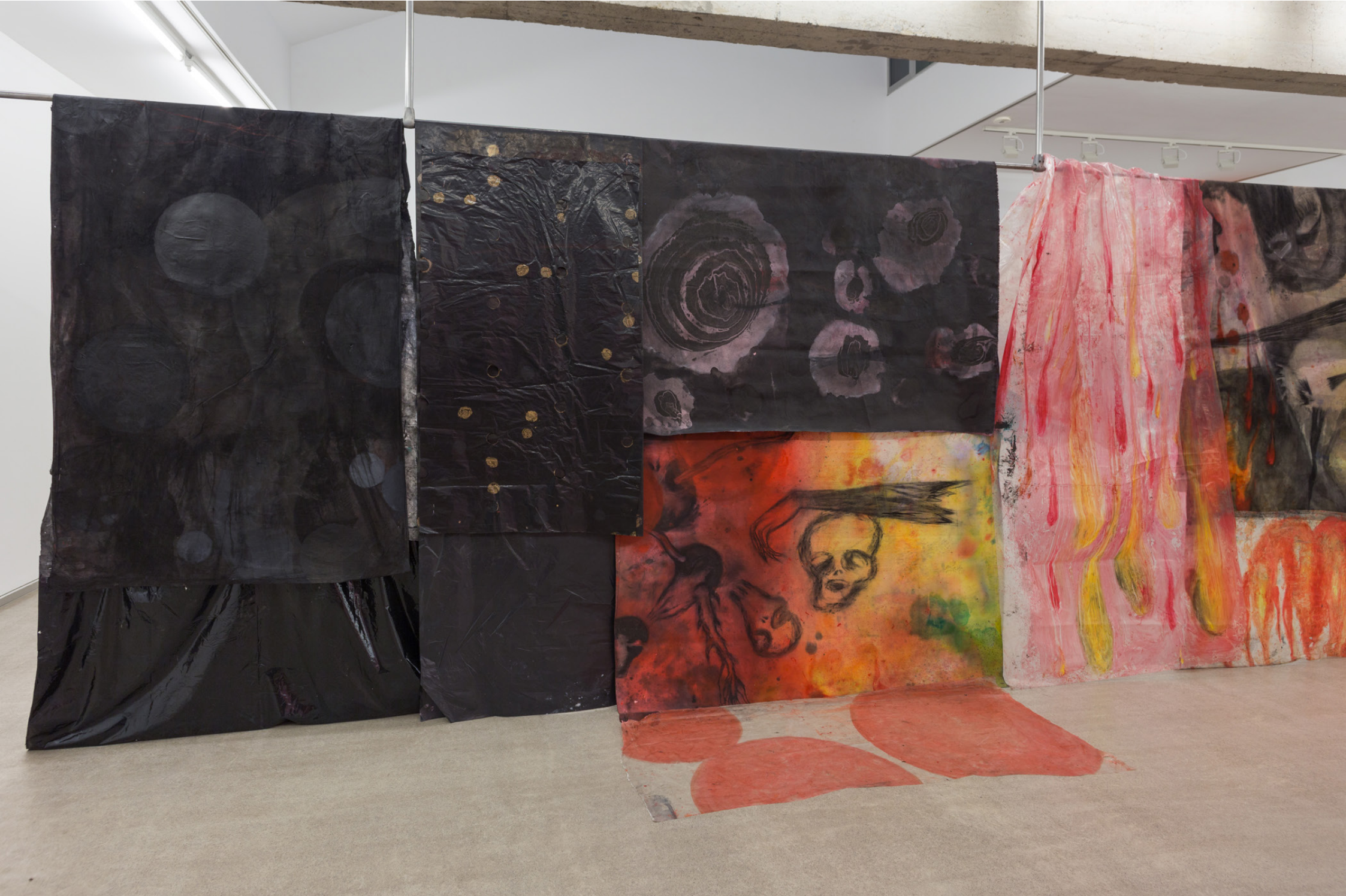
Cortinone 3, 2023 (detalle). Tinta, óleo y grafito sobre tela y plástico. Medidas variables.