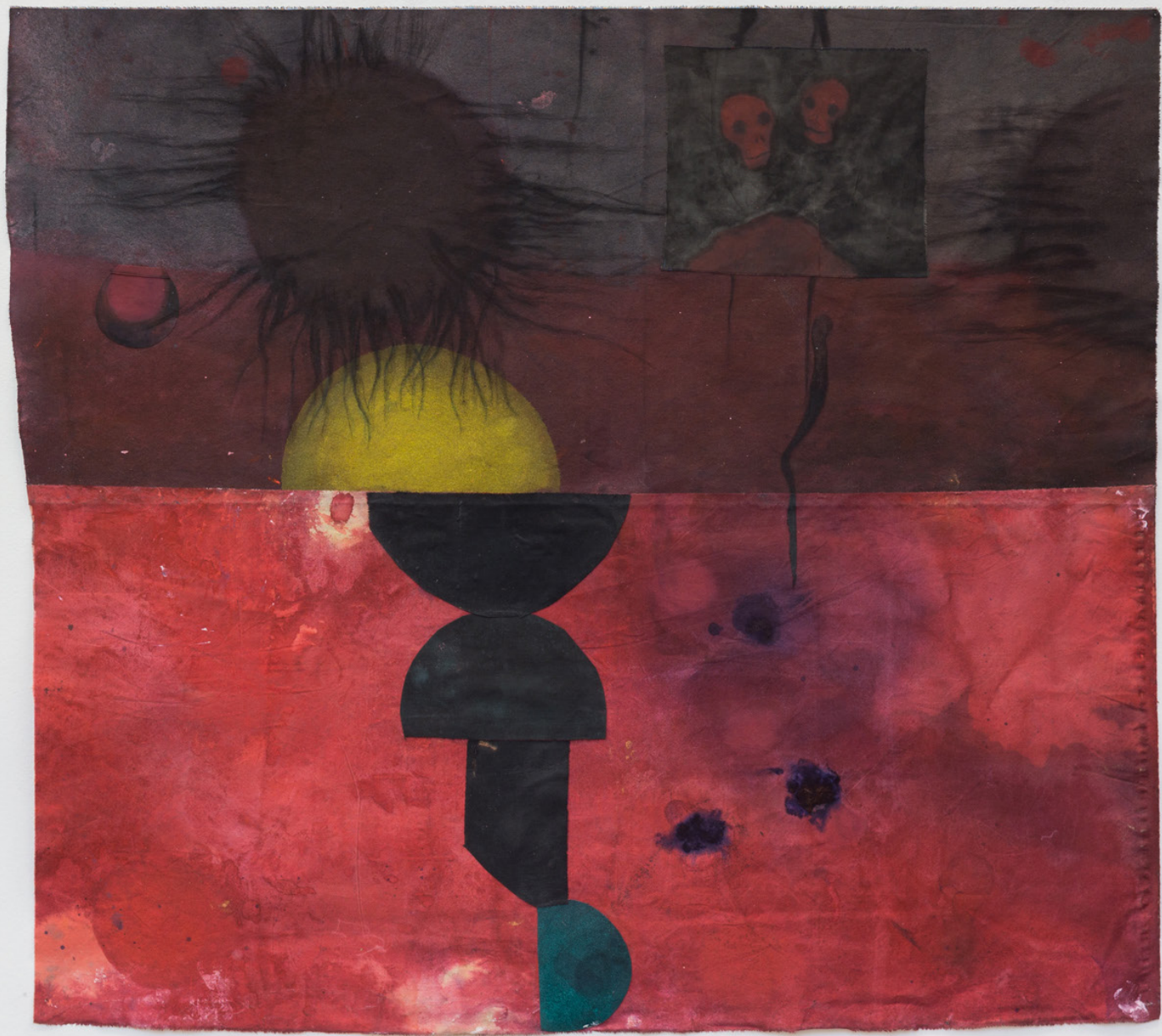
Incendios venideros , 2023. Tinta y grafito sobre tela. 106 x 116 cm.