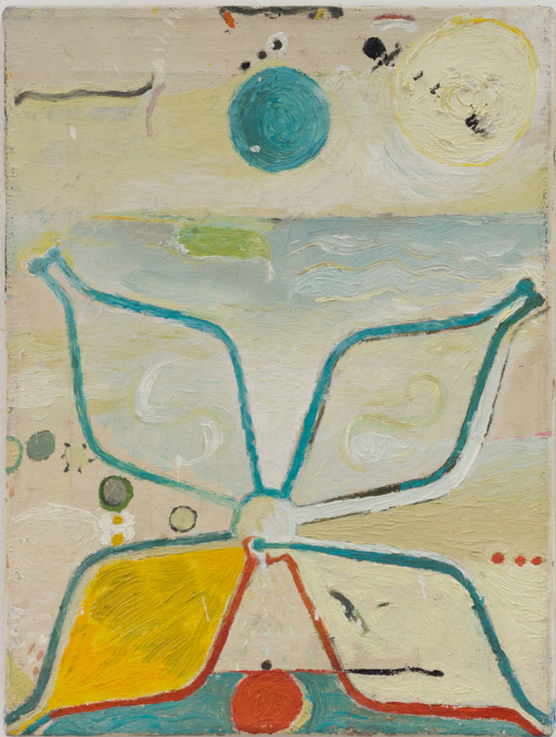
Mediterraneo , 1988. Óleo sobre tela. 40 x 30 cm.