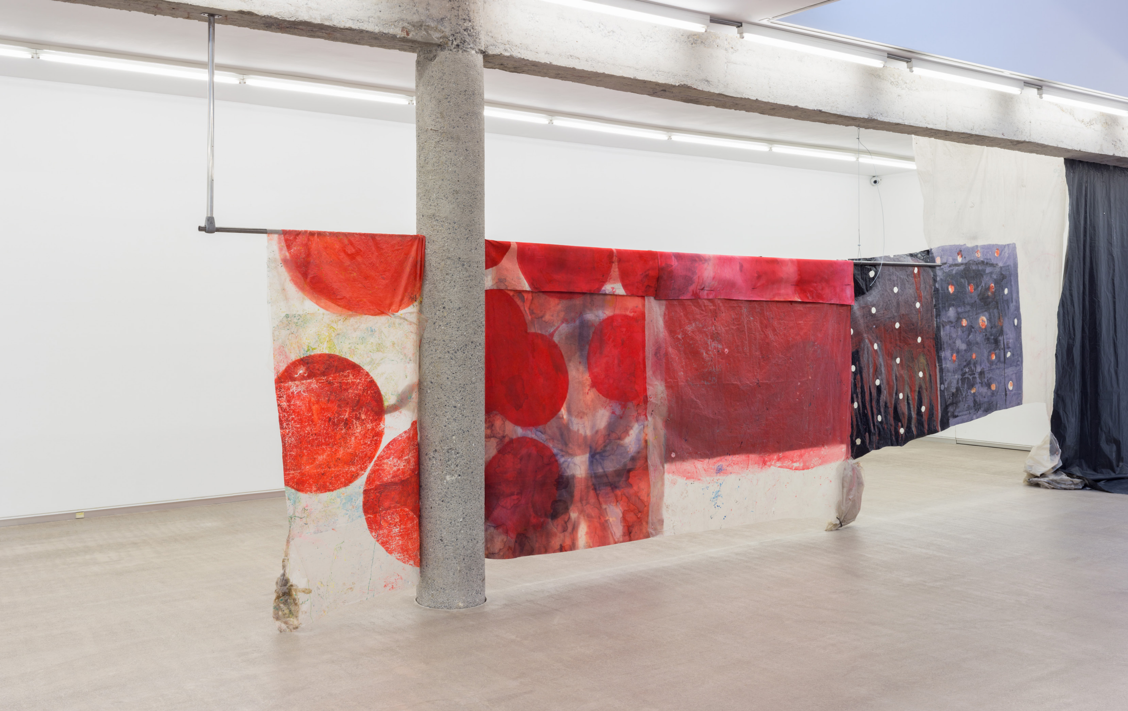
Cortinone 1 , 2023. Tinta, óleo y acrílico sobre tela y plástico. Medidas variables.