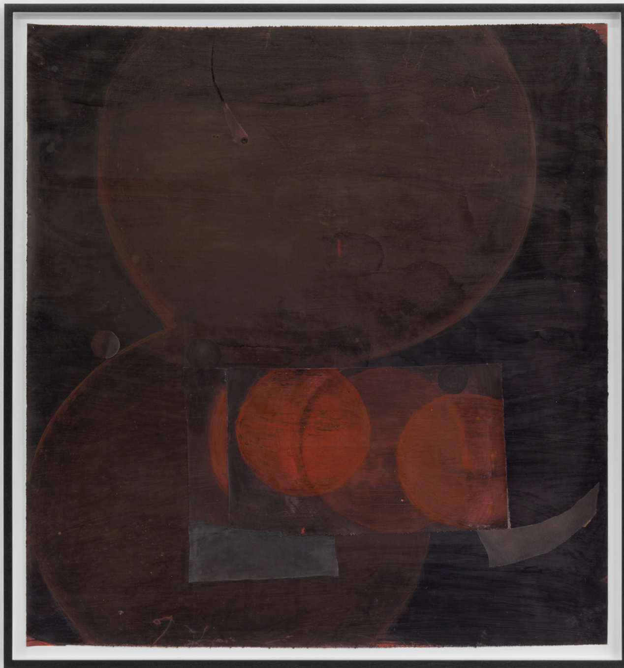
Círculo deambulante , 2023. Tinta y plástico sobre tela. 104 x 98 cm.