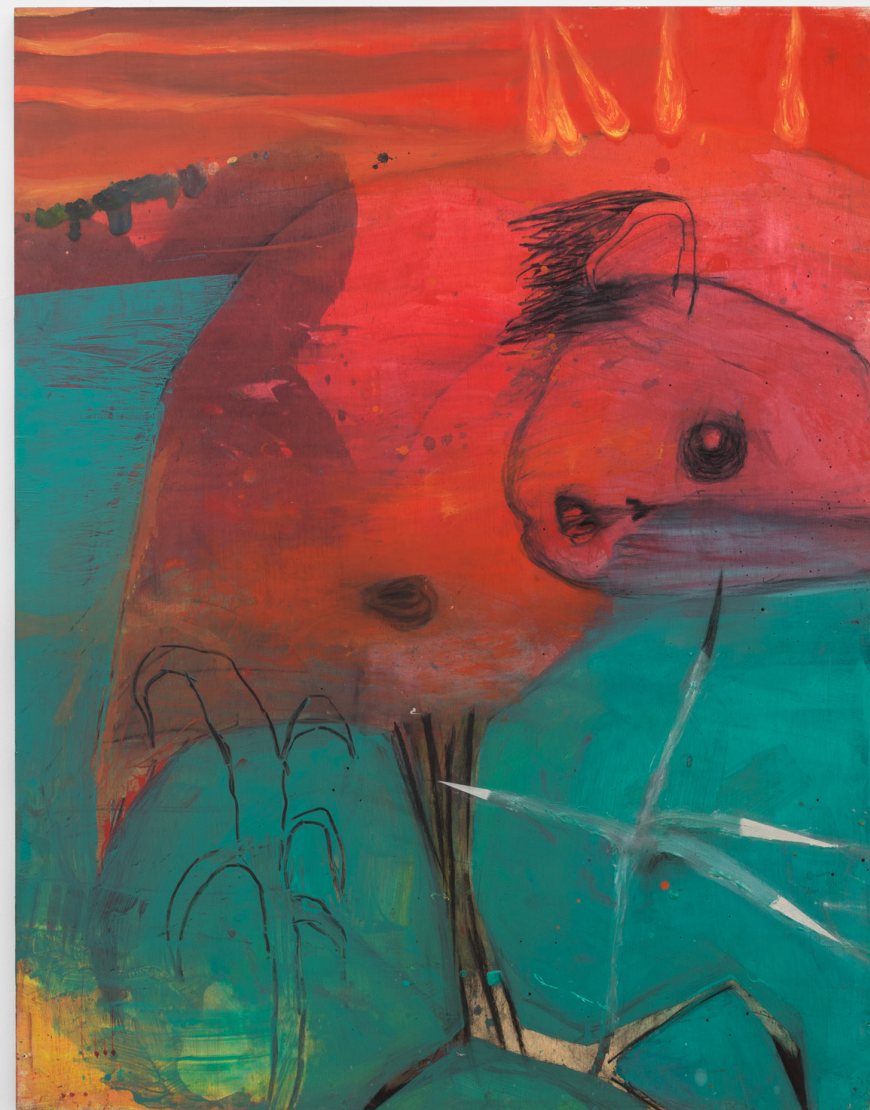
My idols are dead and my enemies are in power , 2022. Tinta y grafito sobre madera. 146 x 114 cm.