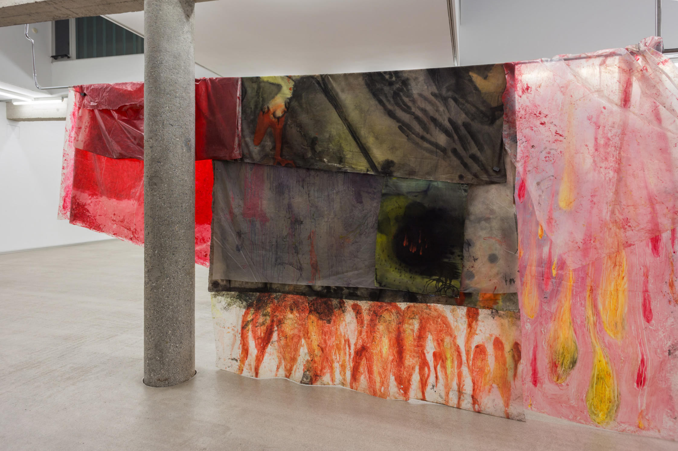
Cortinone 3, 2023 (detalle). Tinta, óleo y grafito sobre tela y plástico. Medidas variables.