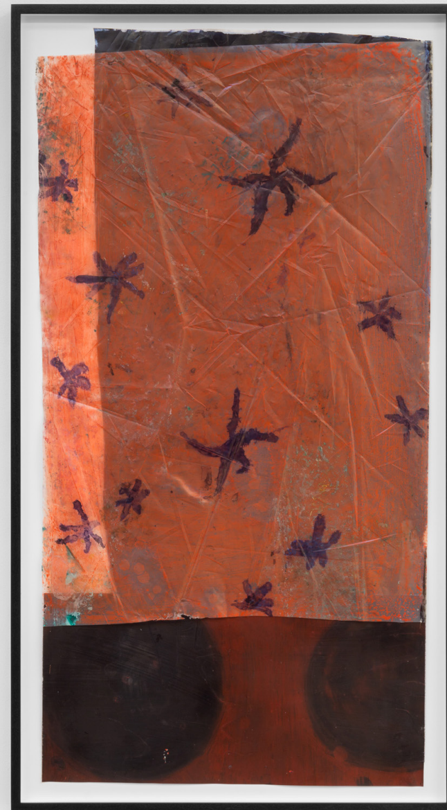
Círculo deambulante , 2023. Tinta sobre plástico y tela. 110 x 57 cm.