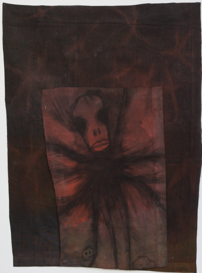
Sutagar , 2023. Tinta sobre tela. 97 x 71 cm.