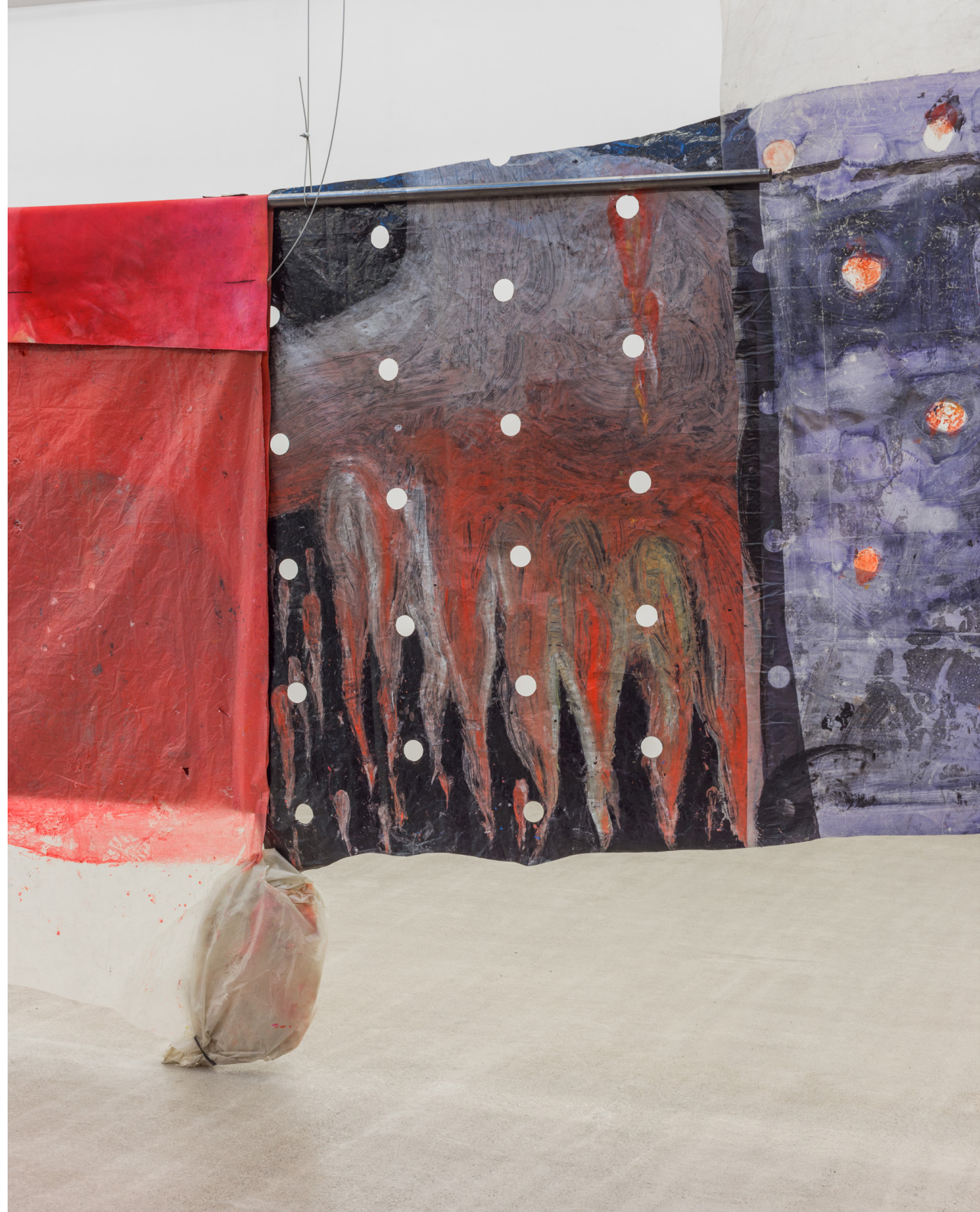
Cortinone 1, 2023 (detalle) Tinta, óleo y acrílico sobre tela y plástico. Medidas variables