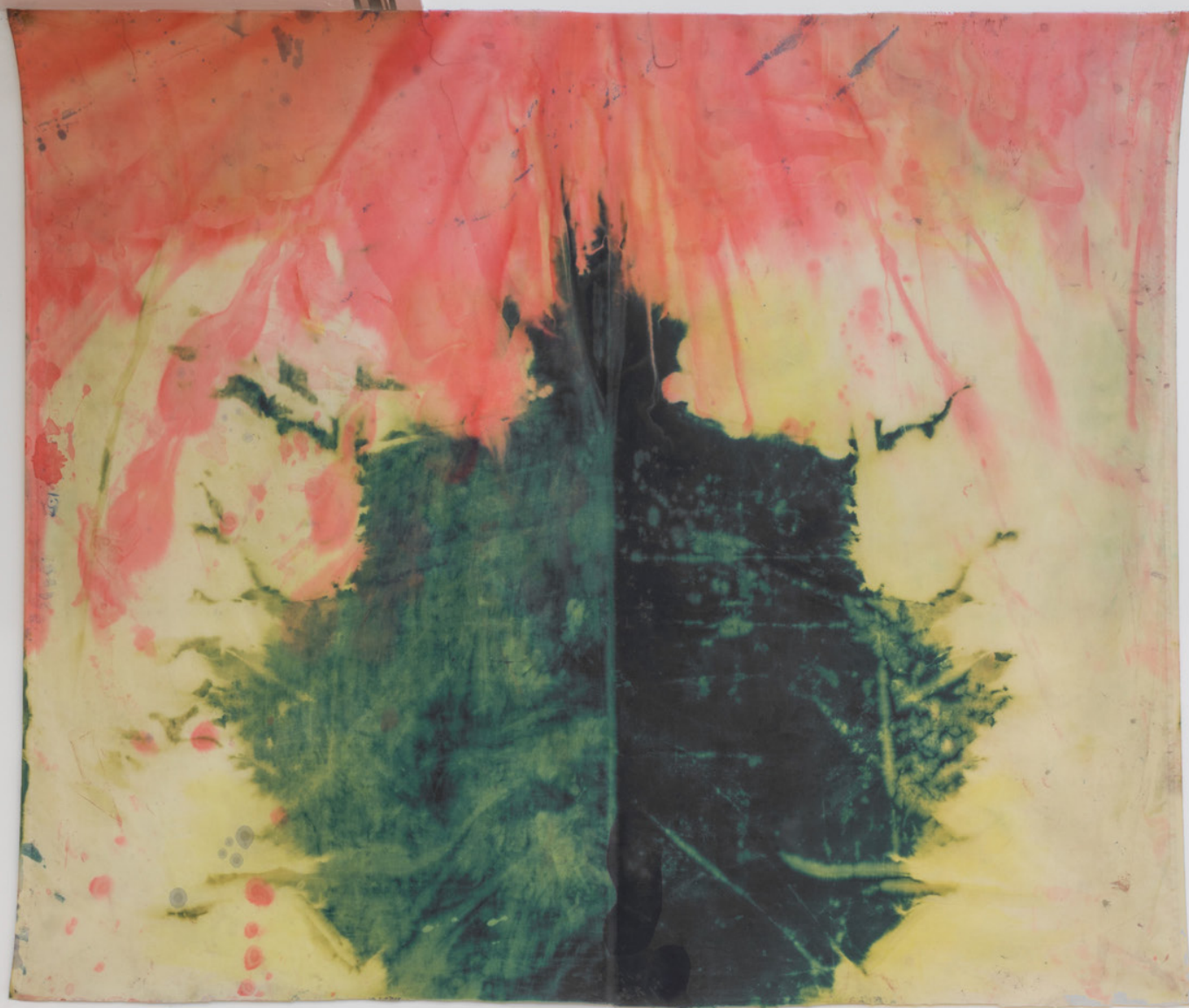
Vegetal , 2023. Tinta sobre tela. 122 x 138 cm.