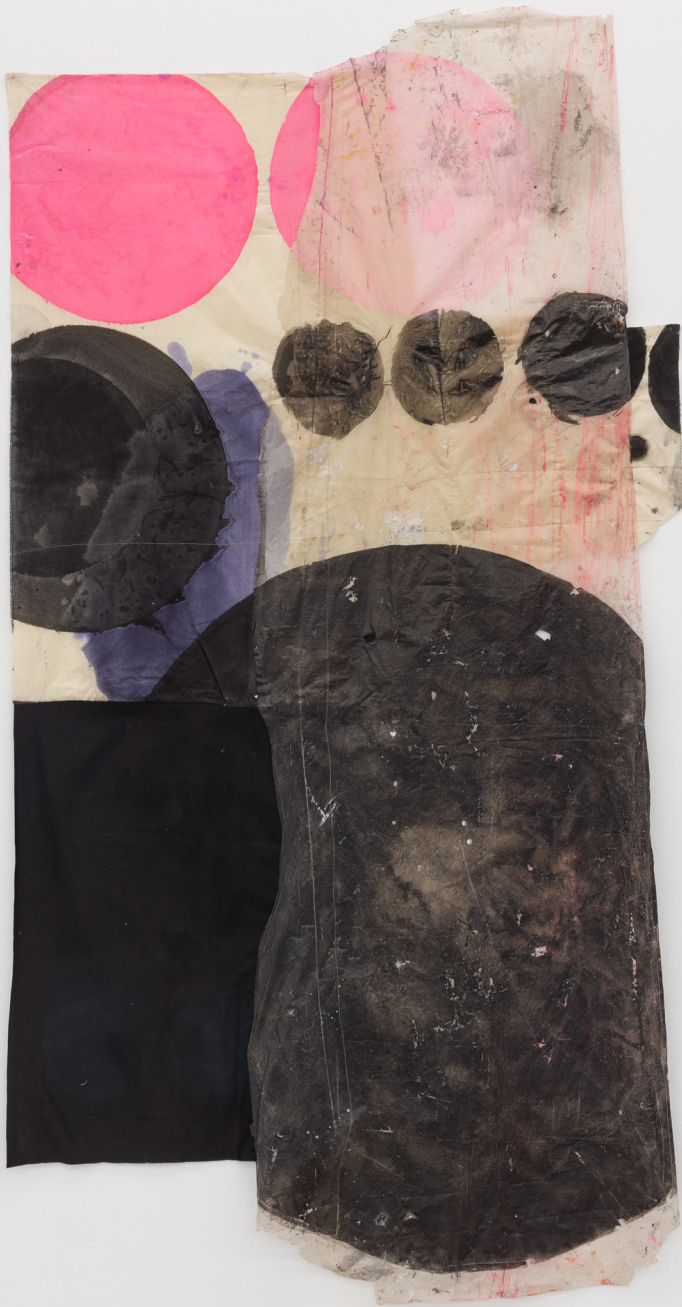
Meteora , 2023. Tinta y tela sobre plástico. 270 x 141 cm.