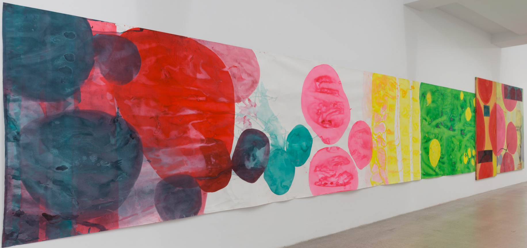
Círculos , 2023. Tinta, acrílico y grafito sobre papel tela y madera. 200 x 1100 cm.