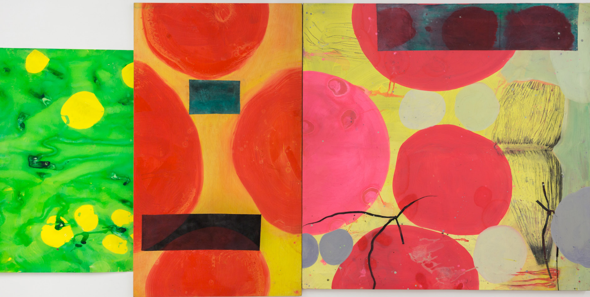
Círculos , 2023 (detalle). Tinta, acrílico y grafito sobre papel, tela y madera. 200 x 1100 cm.