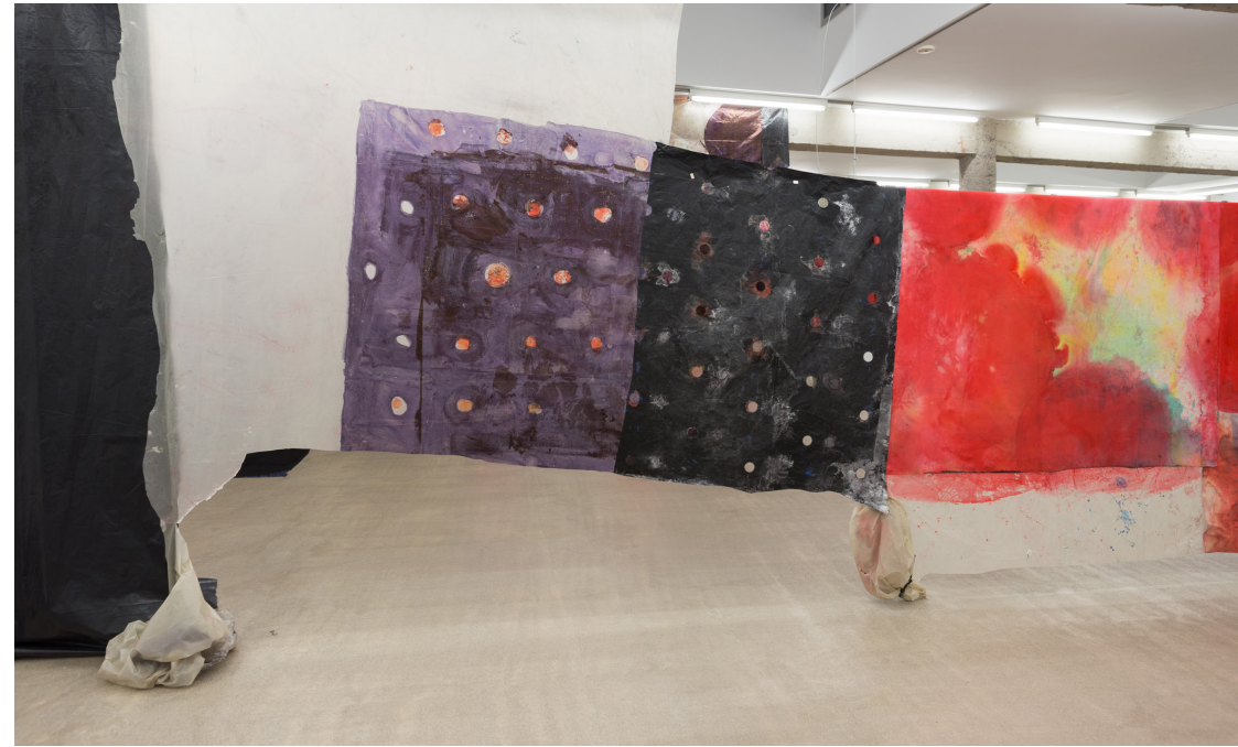
Cortinone 1, 2023 (detalle) Tinta, óleo y acrílico sobre tela y plástico. Medidas variables