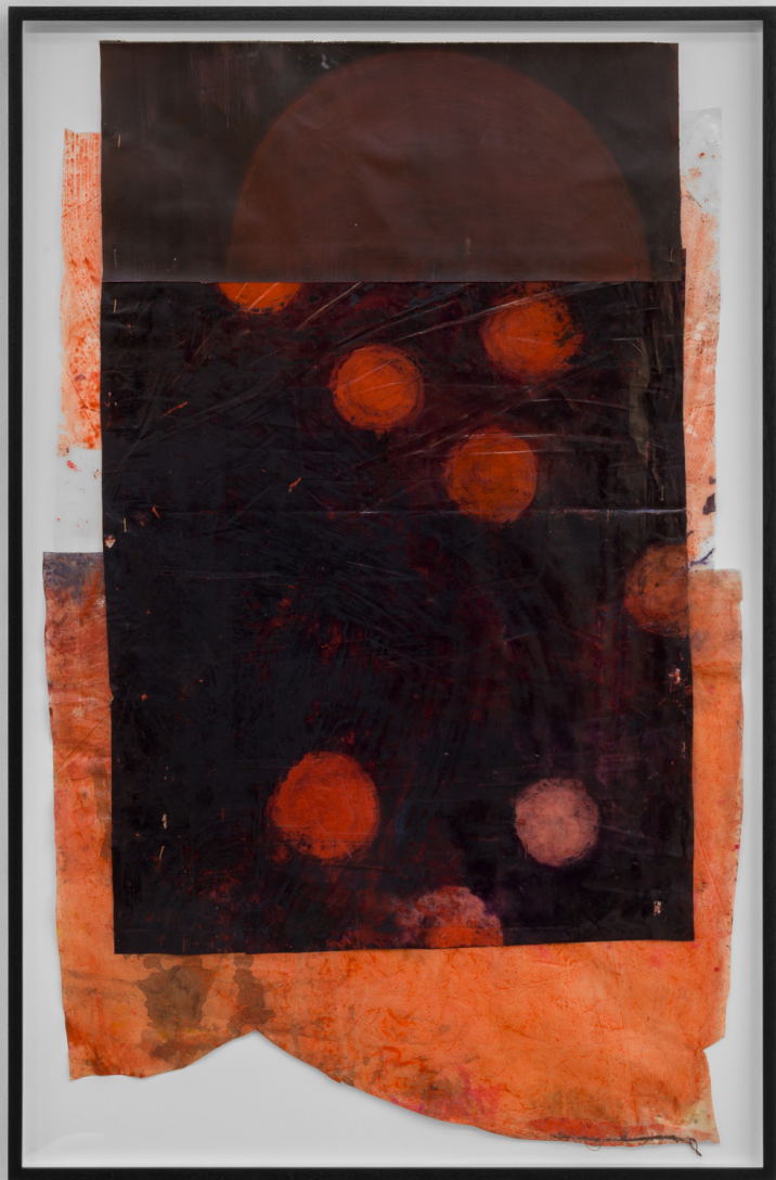
Círculo deambulante , 2023. Tinta sobre plástico y tela. 112 x 70 cm.