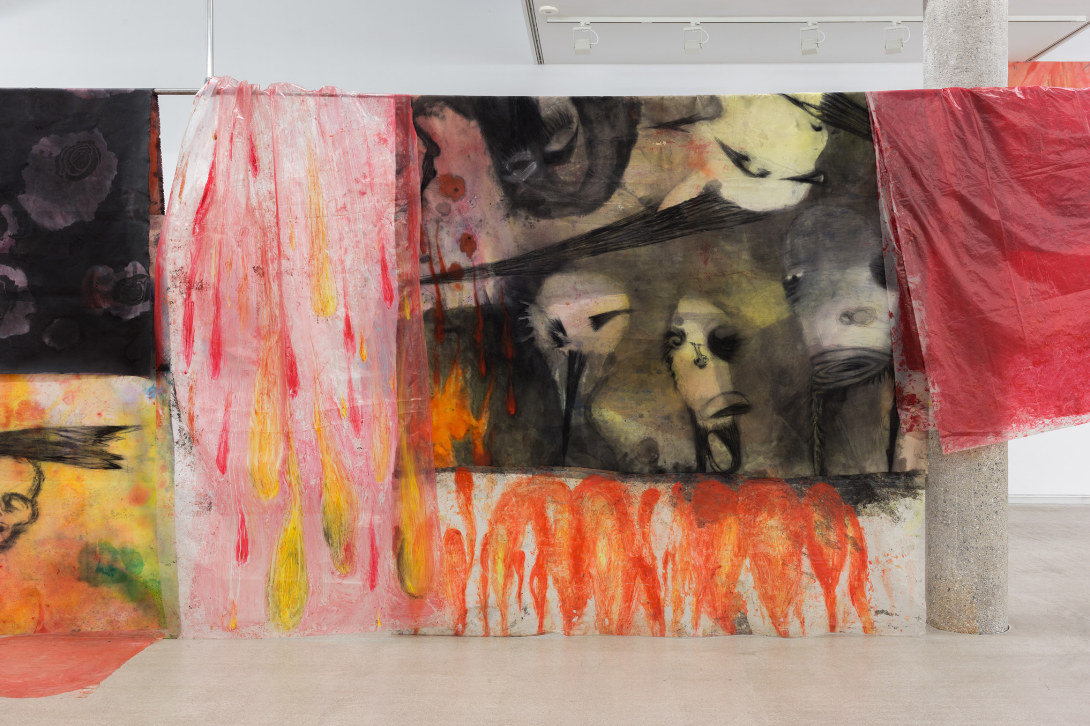
Cortinone 3, 2023 (detalle). Tinta, óleo y grafito sobre tela y plástico. Medidas variables.