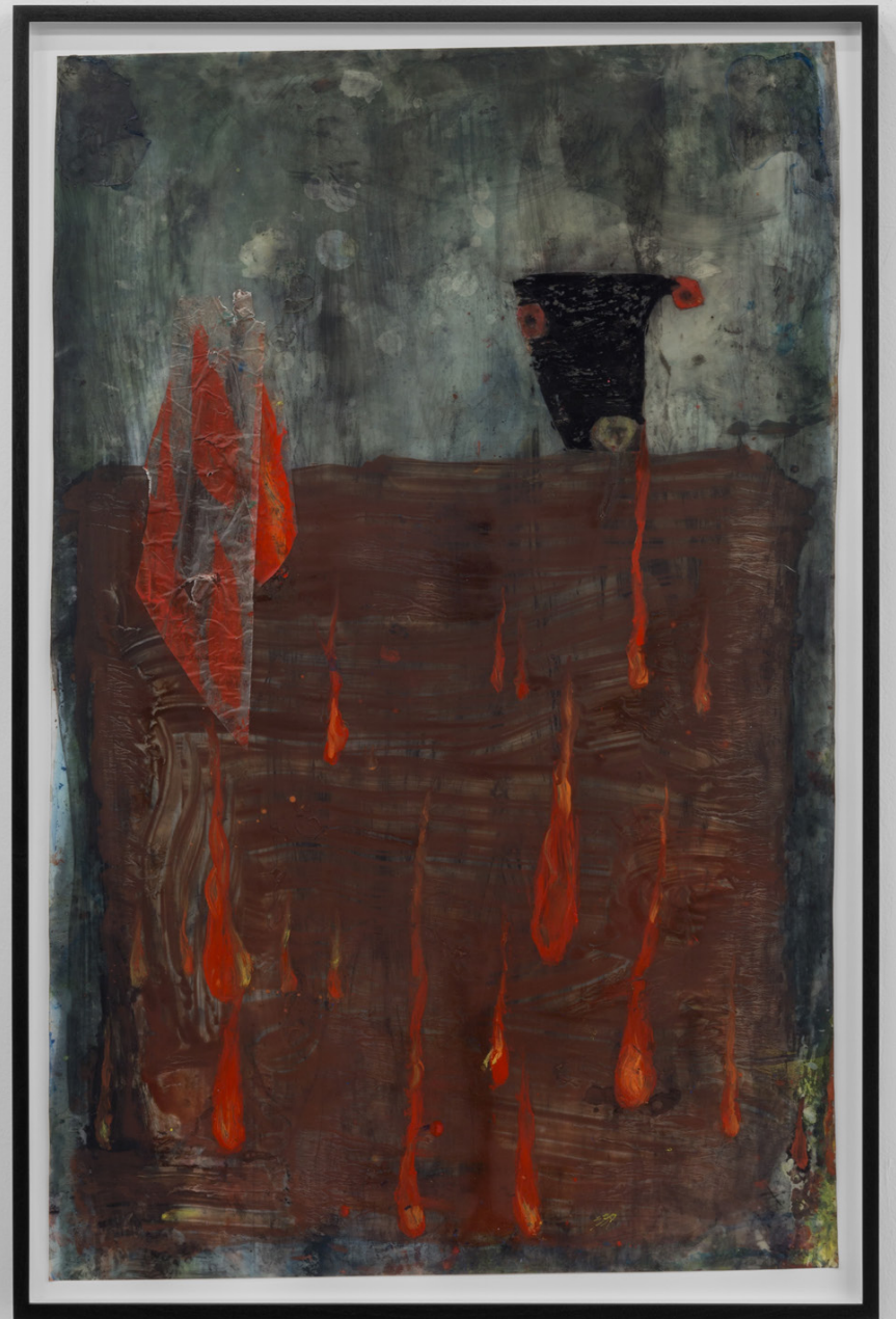
On fire , 2022. Óleo y tinta sobre mylar. 108 x 67 cm.