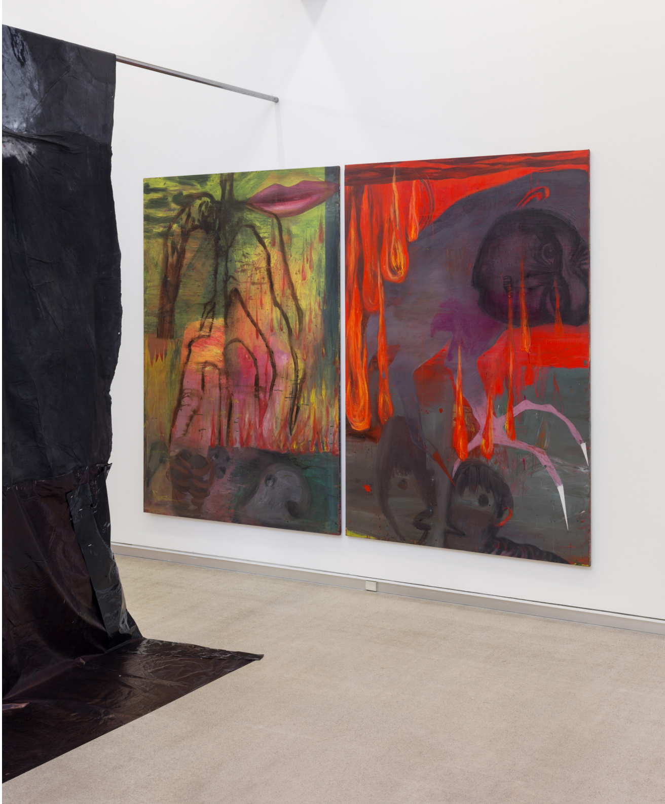
(izda) Planta boca , 2021 Óleo sobre tela 195 x 130 cm.