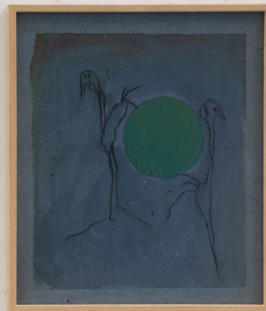
Uccellacci , 1989. Grafito y papel sobre papel. 22 x 19 cm.