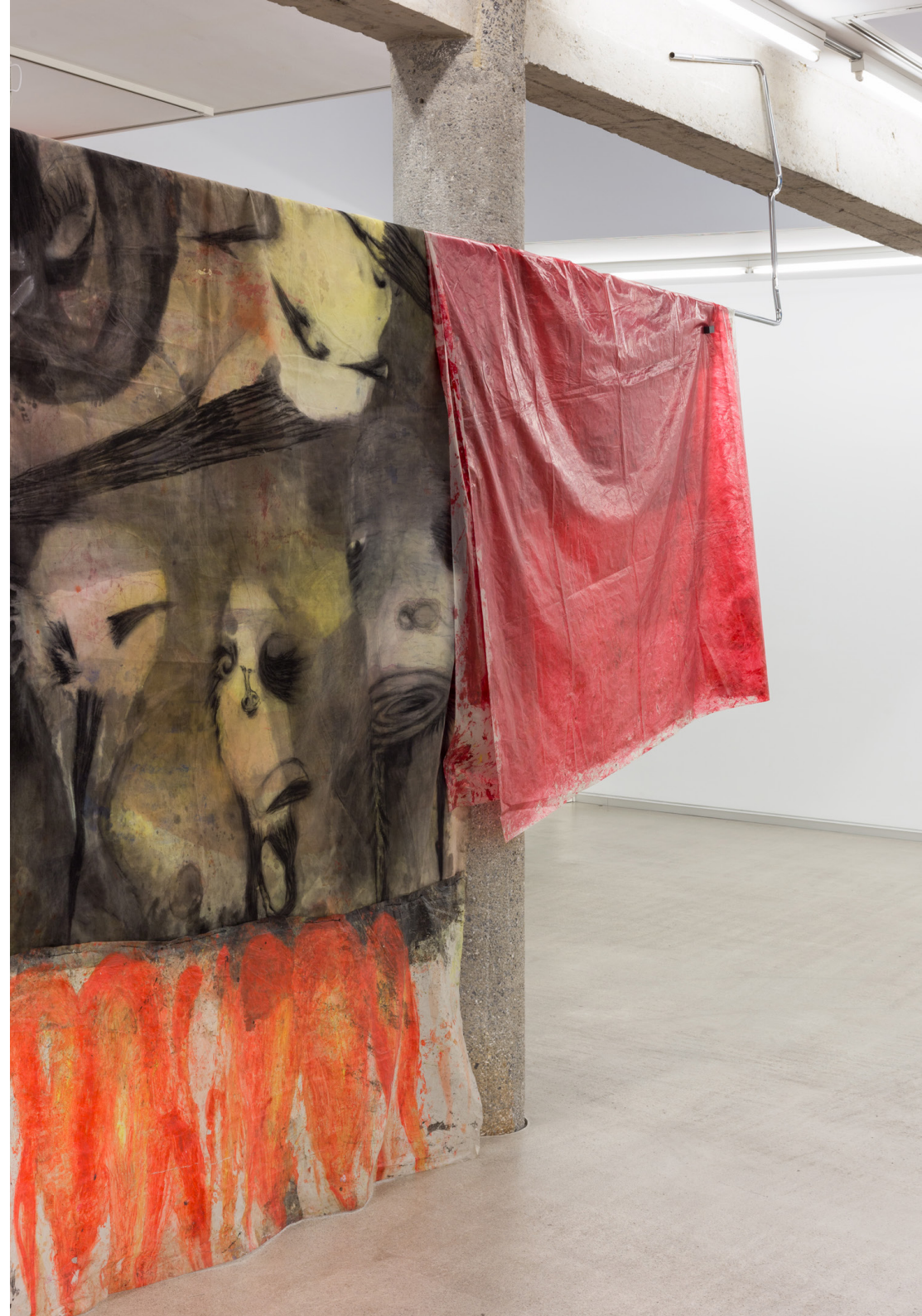
(derecha) Cortinone 3, 2023 (detalle) Tinta, óleo y grafito sobre tela y plástico. Medidas variables